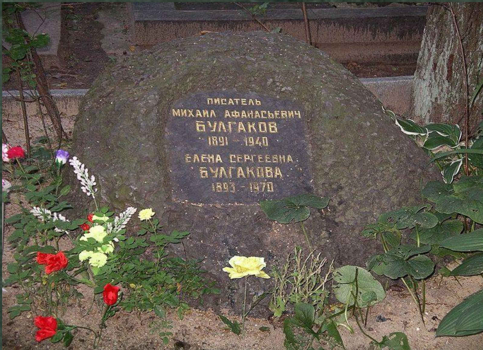
Камень с могилы Н. Гоголя на могиле М. Булгакова