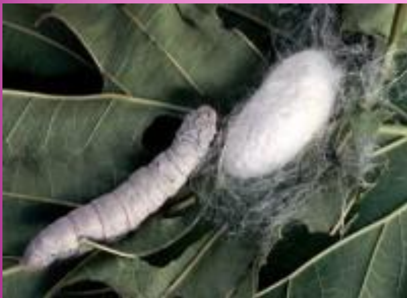
Кокон тутового шелкопряда