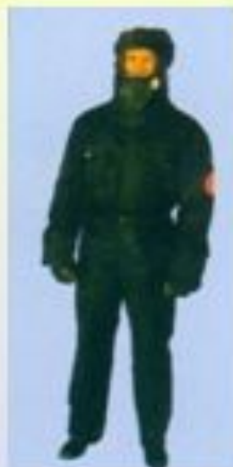
ФЗО-МП, ФЗО- МП-А (комплект фильтрующей защитной одежды)

(костюм защитный водонепроницаемый универсальный)