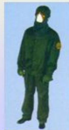
ПЗО-1, ПЗО-2 (комплект одежды пылезащитной)

(комплект вентилируемой специальной одежды)