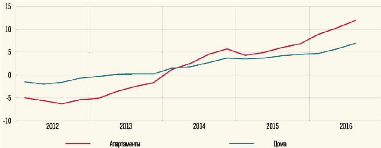
ЦЕНЫ НА НЕДВИЖИМОСТЬ В ЧЕХИИ в % к соответствующему кварталу предыдущего года