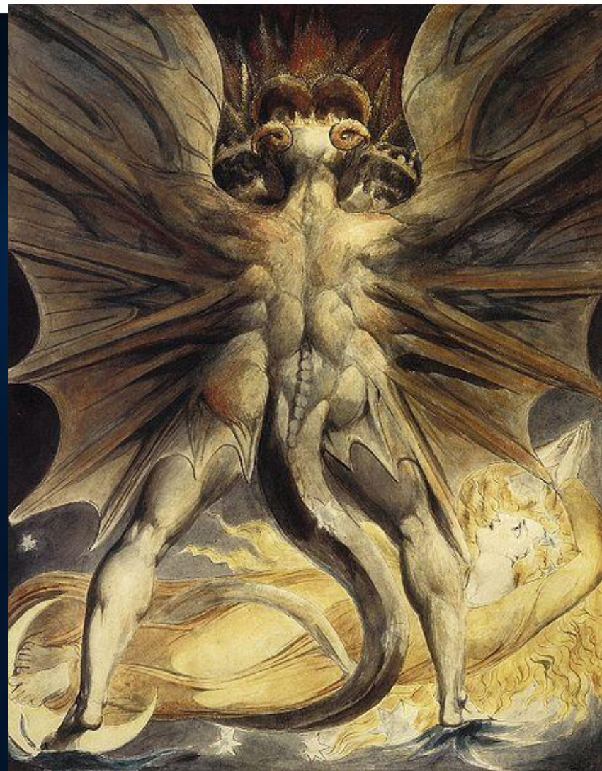
Картина Уильяма Блейка.

В иудео-христианской традиции Сатана является олицетворением зла.