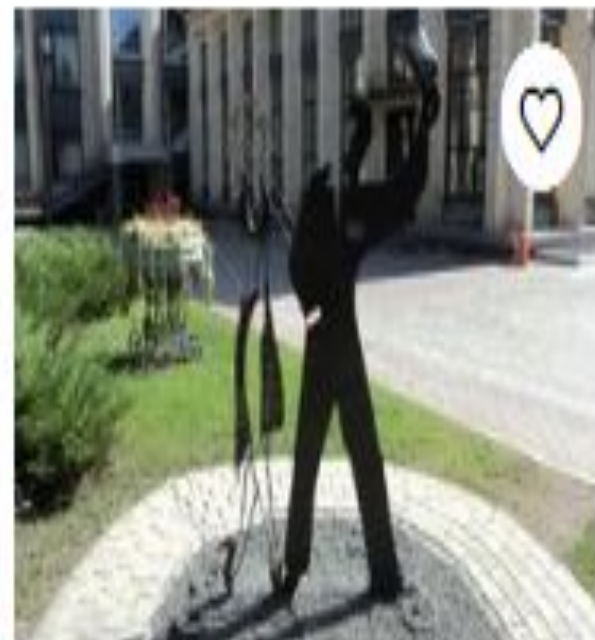
Парк кованых фигур