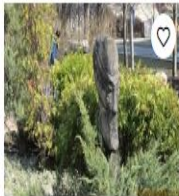
Парк скульптур "Укр...