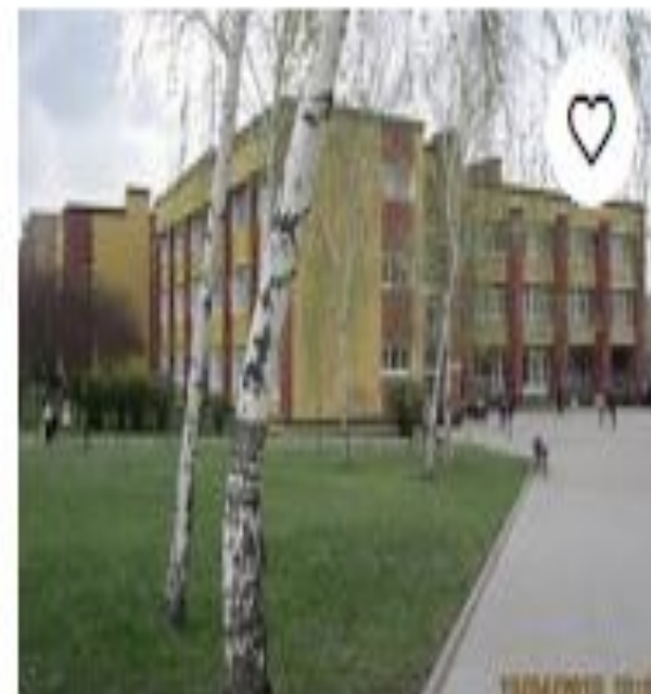
Парк имени 30-лети...