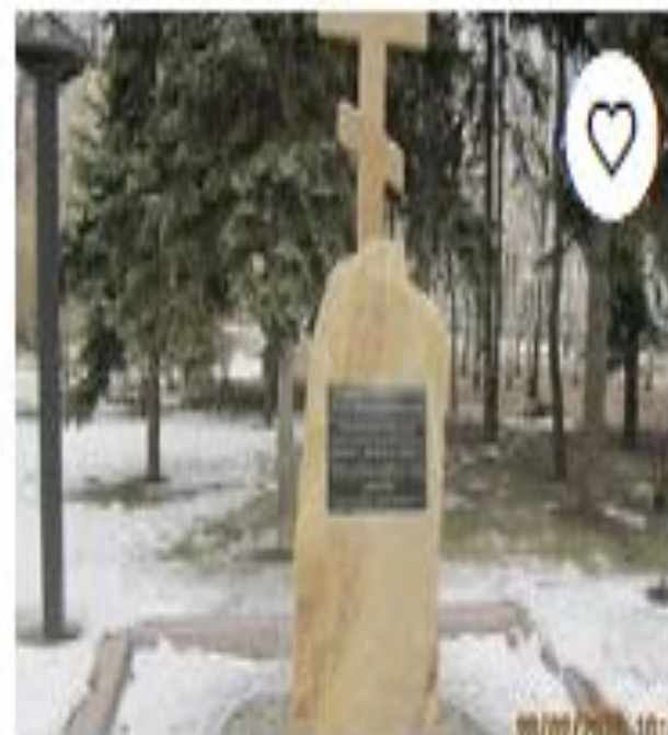
Парк славянской ку...