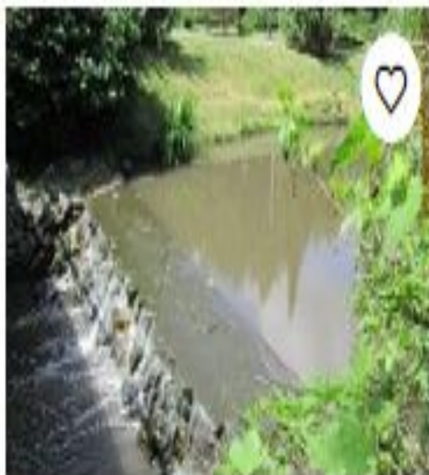
Парк фабрики Конти