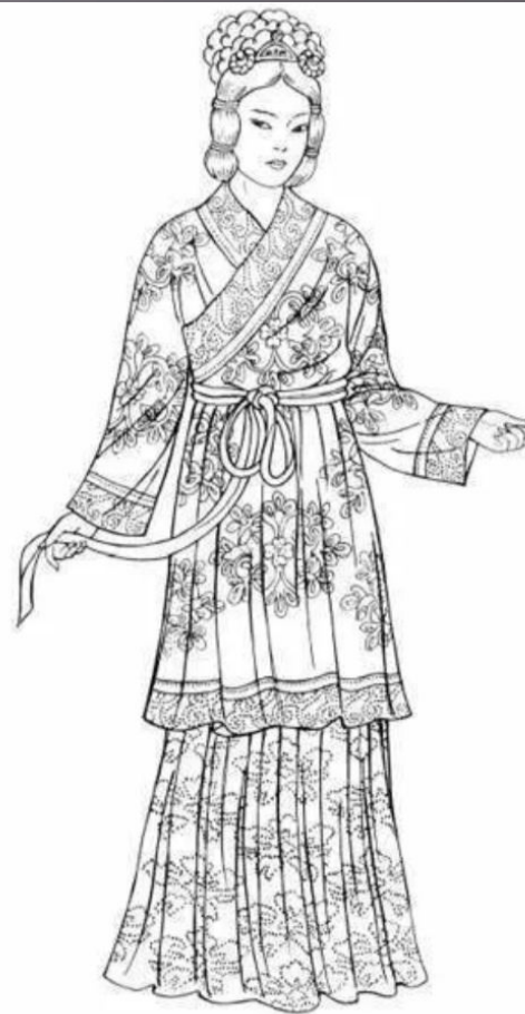
Yuan Dynasty. This upper-class woman wears a wrap tunic with double bands of embroidered design at the opening, sleeve, and hem. Her hat, made of silk, has