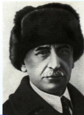
1 Житков Б.