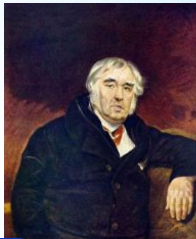
2 Крылов И.