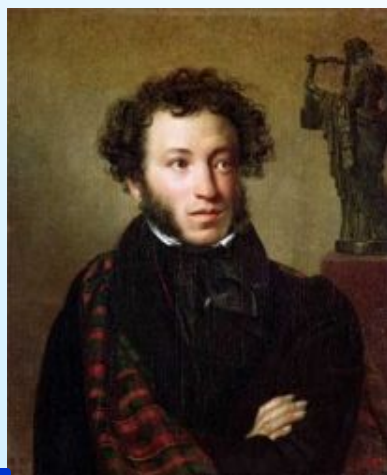
3 Пушкин А.