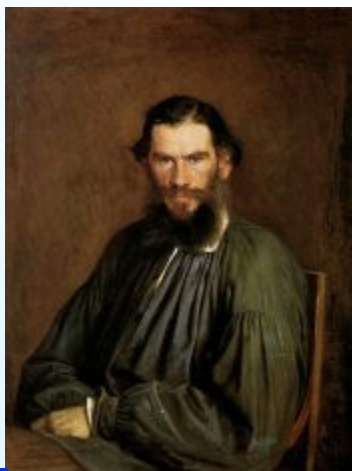
4 Толстой Л.

Напиши фамилии писателей в алфавитном порядке.