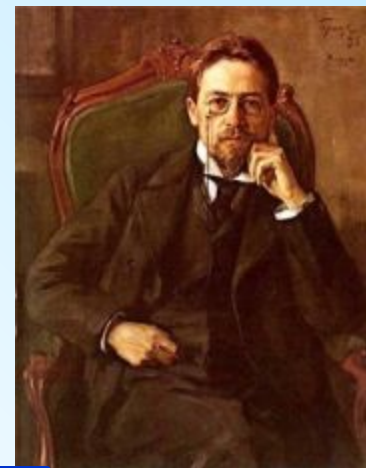
5 Чехов А.