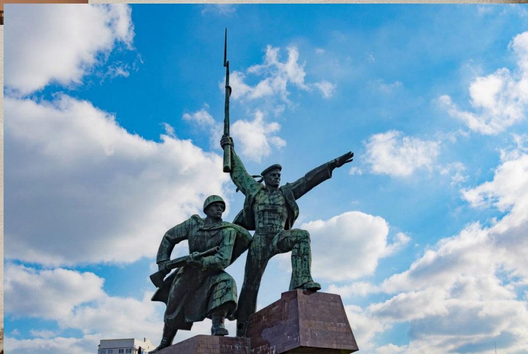
Памятник Солдату и Матросу

Памятник установлен на Хрустальном мысу. Его видно практически из любой точки города. Символизирует братство защитников Севастополя — моряков и пехоты. Кажется, что фигура Матроса несколько доминирует, но пехотинец изображен рядом с ним как равноправный соратник.