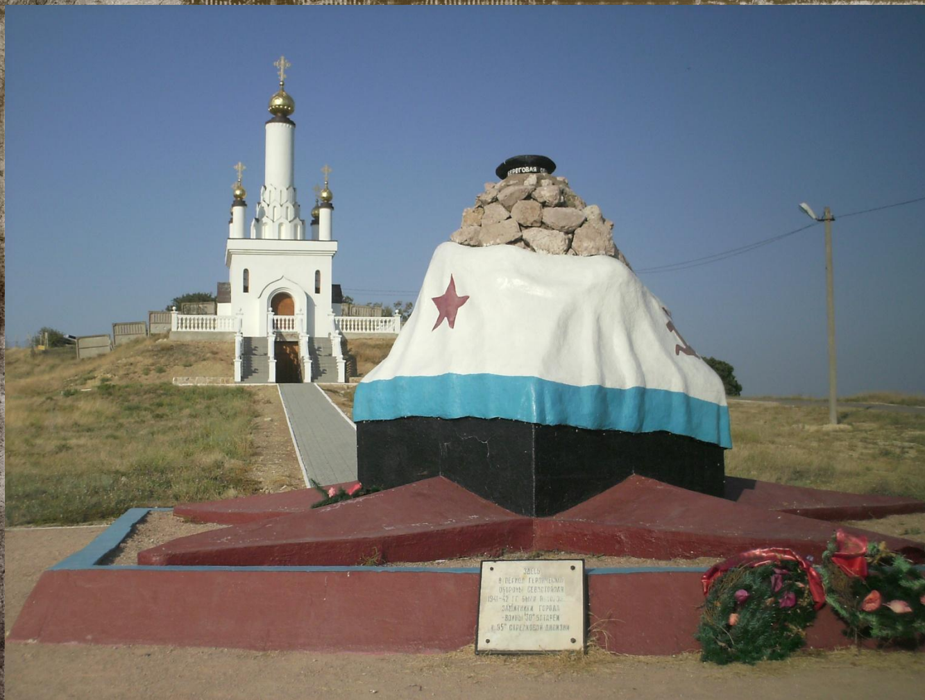
Памятник на могиле воинов 30 батареи 95 стрелковой дивизии.