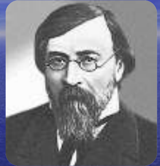
Н.Г. ЧЕРНЫШЕВСКИЙ (1828-1889 Г.Г.)