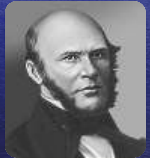
Н.И. Пирогов (1810-1881 г.г.)