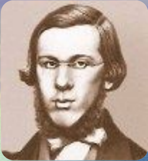
Н.А. Добролюбов (1836-1861 г.г.)