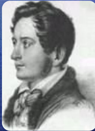
А.И. ГЕРЦЕН (1812-1870 Г.Г.)