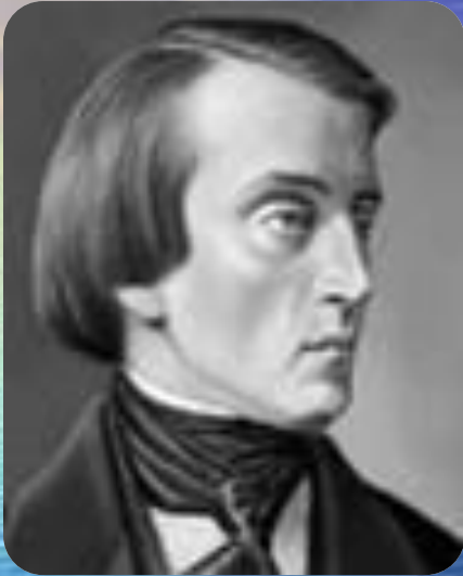
В.Г. БЕЛИНСКИЙ (1811-1848 Г.Г.)