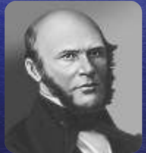
Н.И. Пирогов (1810-1881 г.г.)