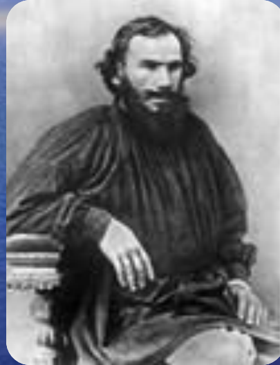
Л.Н. Толстой (1828-1910 г.г.)