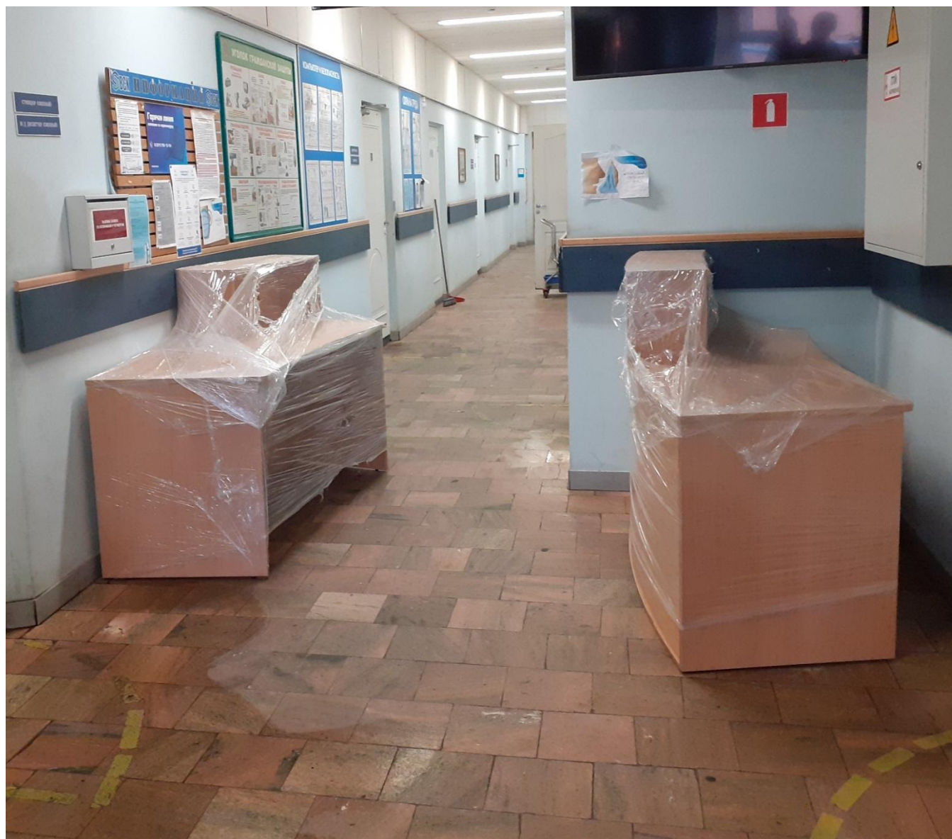
Мебель на пути эвакуации.