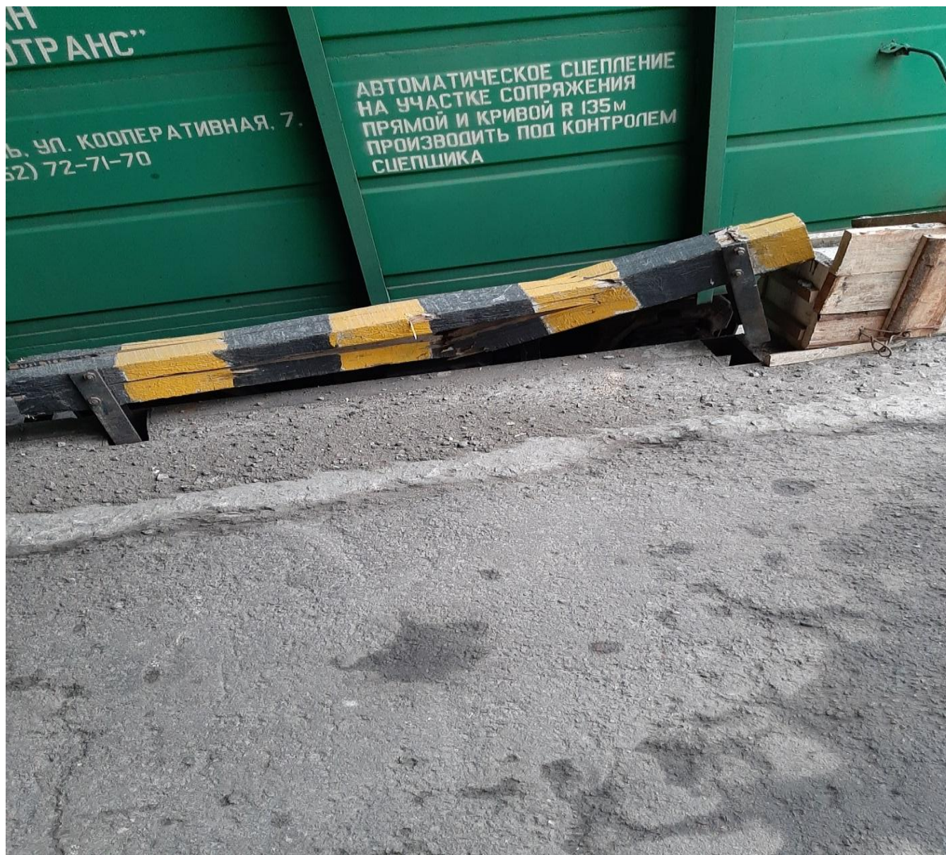
Повреждение колесоотбойного бруса.