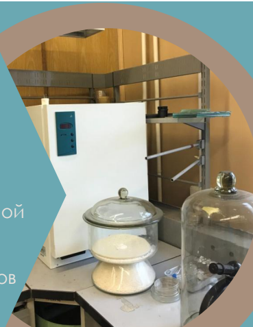
Камера для исследования антимикробных свойств упаковочных материалов

Определение антимикробной активности и грибостойкости упаковочных материалов и установление концентрационной зависимости по «посеву» микроорганизмов