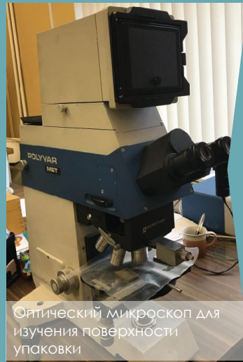
Оптический микроскоп для изучения поверхности упаковки

Исследование процессов биоразложения упаковочных материалов