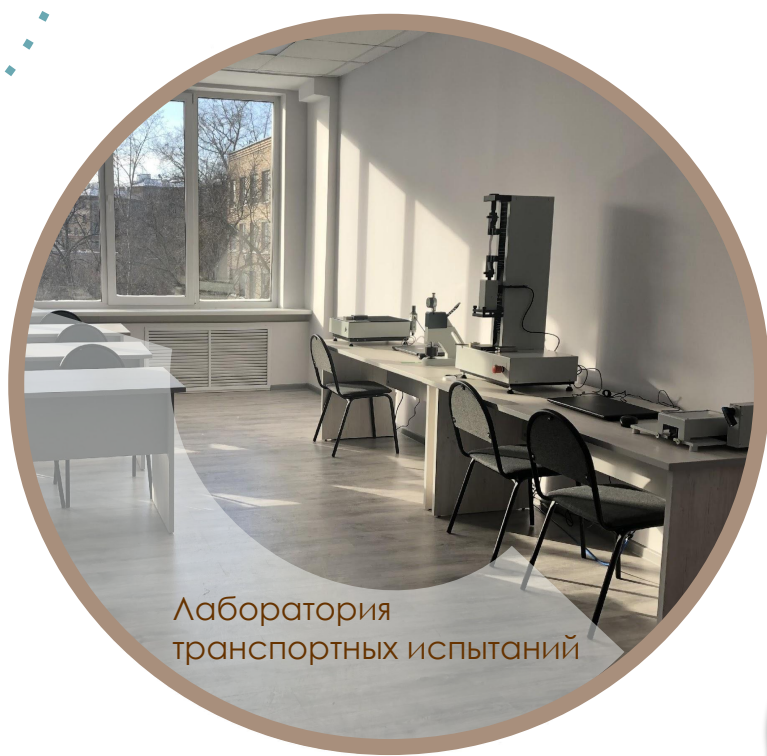
Лаборатория транспортных испытаний