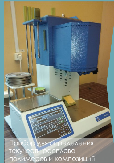
Прибор для определения текучести расплава полимеров и композиций

Исследование процессов биоразложения упаковочных материалов