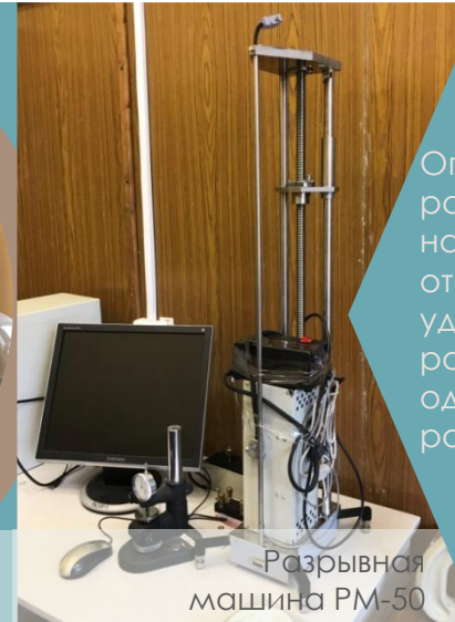
Разрывная машина РМ-50

Определение разрушающего напряжения и относительного удлинения при разрыве при одноосном растяжении