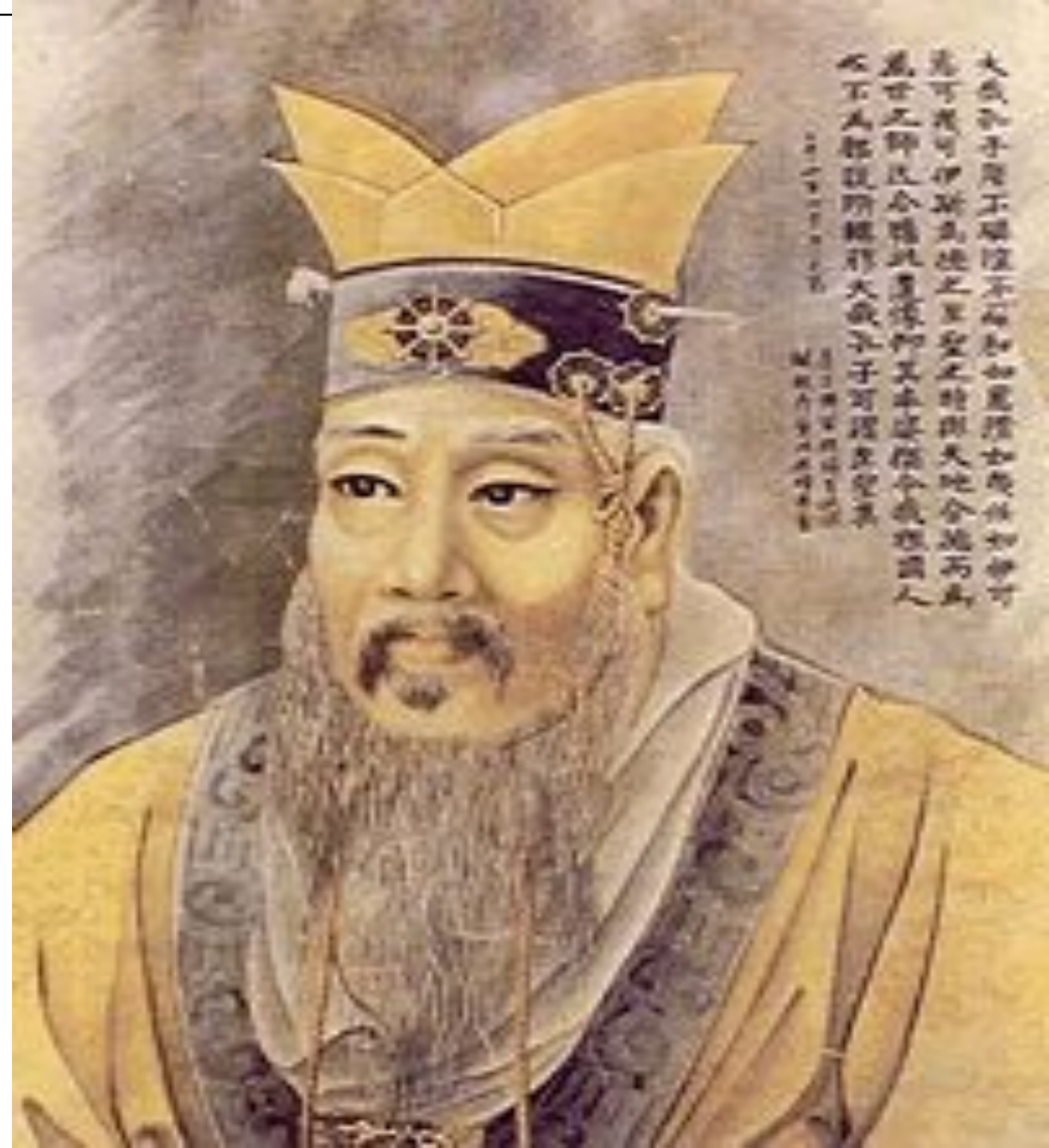
Конфуций , V в.до.н.э