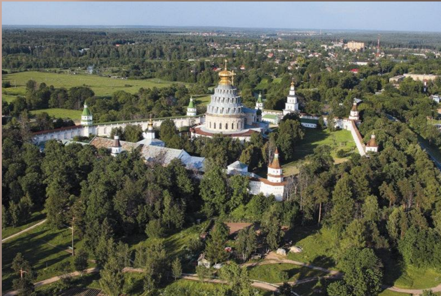
Воскресенский ставропигиальный монастырь