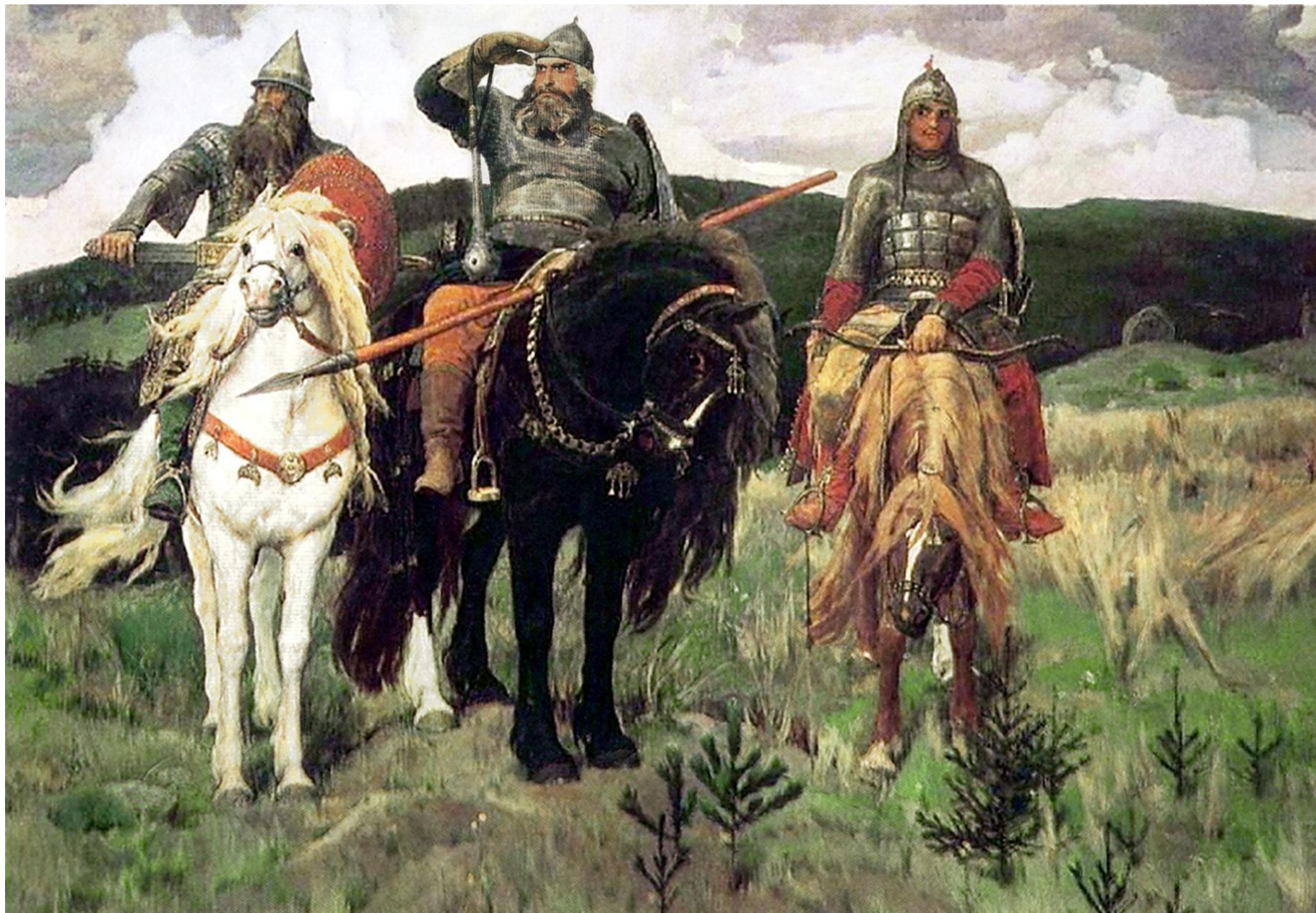
В.М. Васнецов «Богатыри»