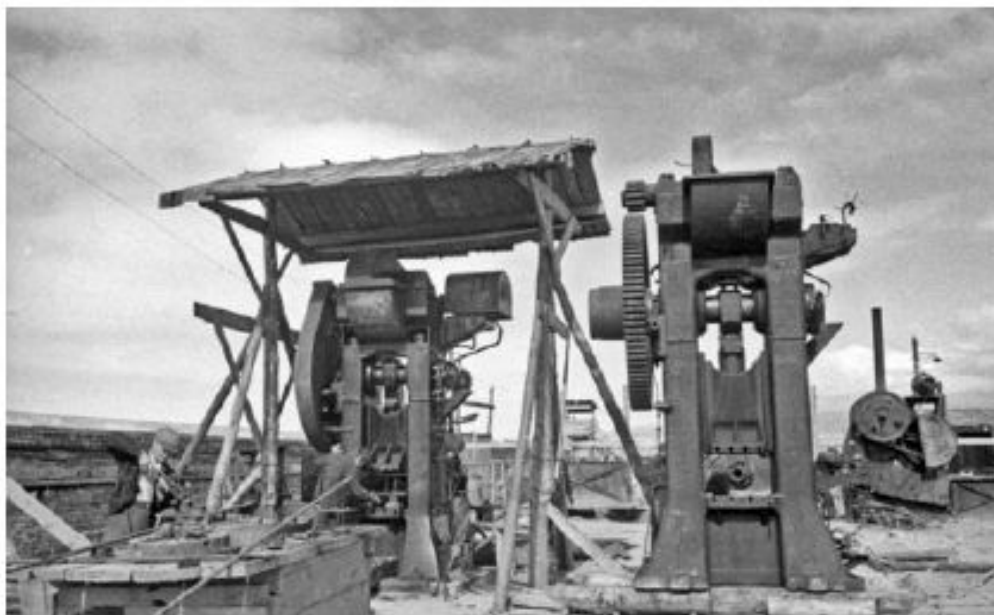
Эвакуированное оборудование, установленное под открытым небом. 1941 г.