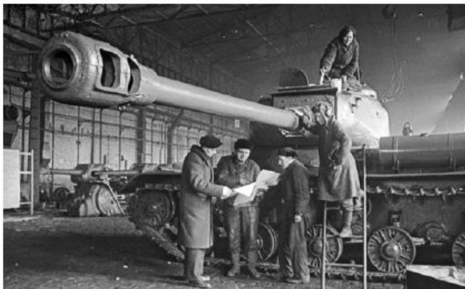
Танк ИС-2 перед военной приемкой на Кировском заводе. Челябинск, 1945 г.