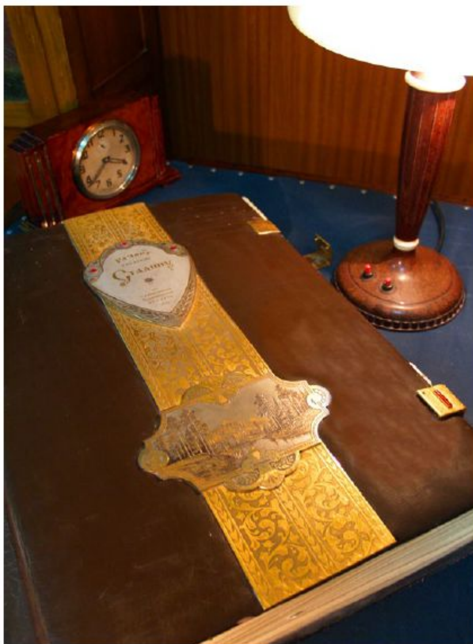
Репорт товарищу Сталину от большевиков Челябинской области. 1944 г. ОГАЧО. Ф. П-288к. Оп. 1. Д. 373