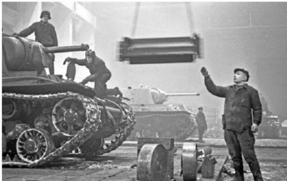
Сборка самоходных артиллерийских установок на Кировском заводе. Челябинск, 1944 г.