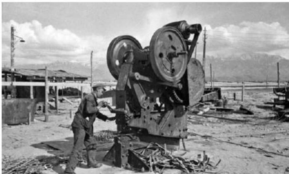
Монтаж эвакуированного оборудования. 1941 г.