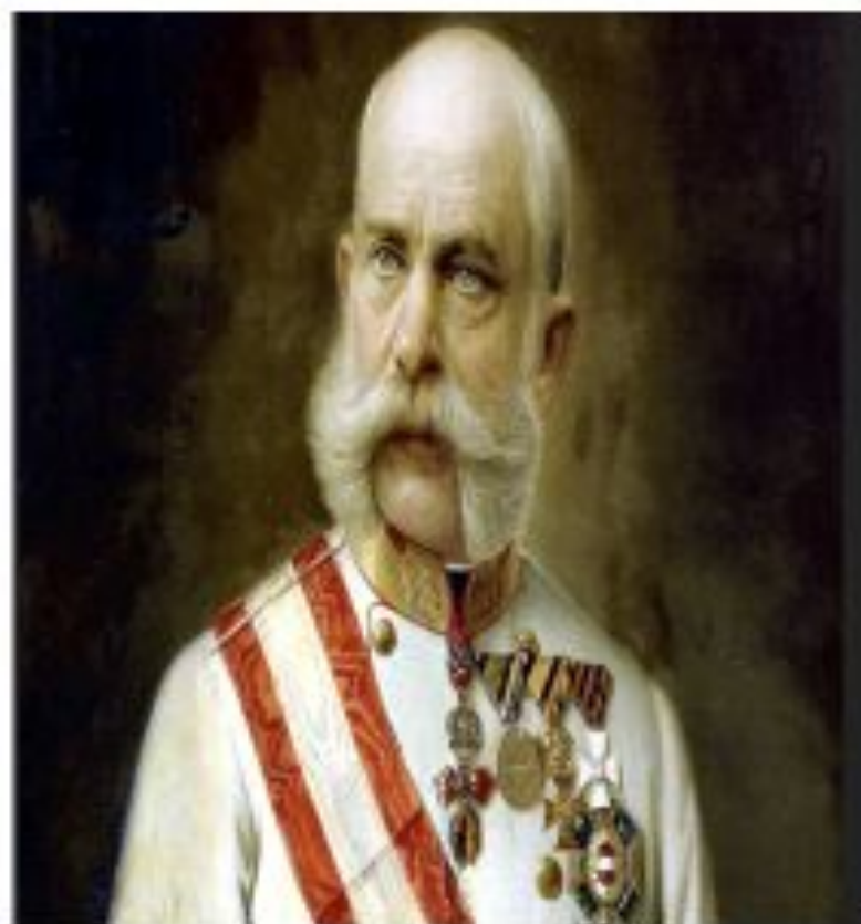
Император Франц Иосиф 1848г-1916г