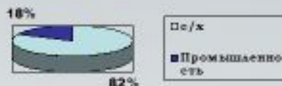
Занятость населения в Галиции, Буковине, Далмации