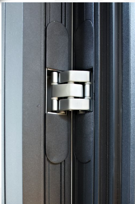
Скрытая петля Kubica 7080

Дверное полотно и рама специально спроектированы для надежной эксплуатации со скрытыми петлями, что обеспечивается за счет правильного внутреннего сечения профилей.