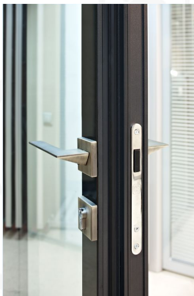
Магнитный замок Laredo