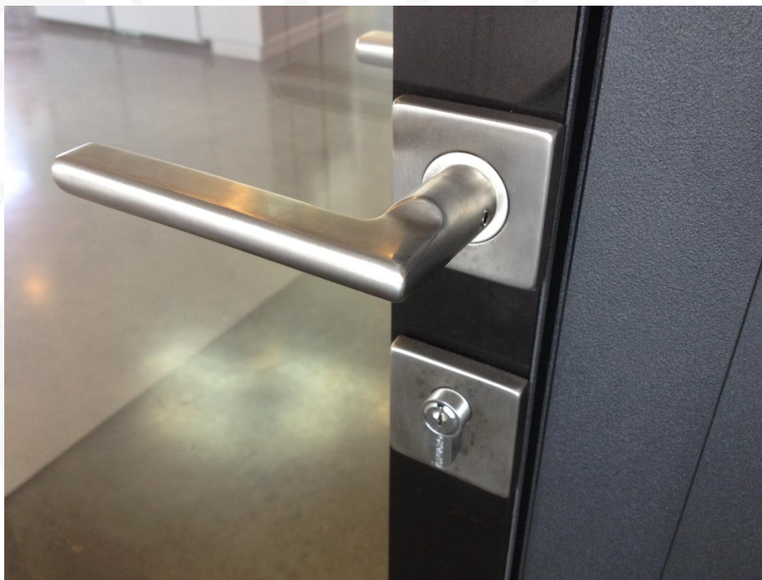
Гарнитур INOX Sunrise нержавеющая сталь.

Гарнитуры на квадратных розетках, поставляемые ООО "Перегородки и двери":