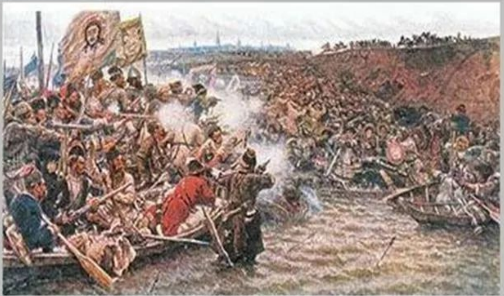
В.И. Суриков Покорение Сибири Ермаком. 1895 г.