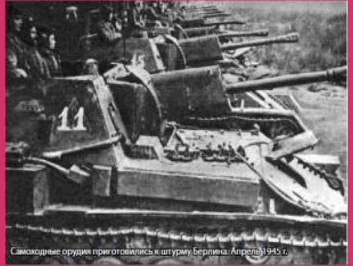
Самоходные орудия приготовились к штурму Берлина. Апрель 1945 г.

Двадцать сибирских дивизий и бригад участвовали в Московской битве. Они сражались насмерть на Бородинском поле и под Истрой, под Волоколамском, Серпуховом и Тулой.