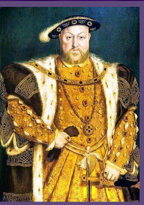
Генрих VIII Тюдор. Король Англии