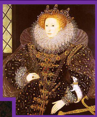
Елизавета I Тюдор. Королева Англии