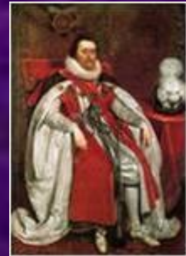
Яков I Стюарт