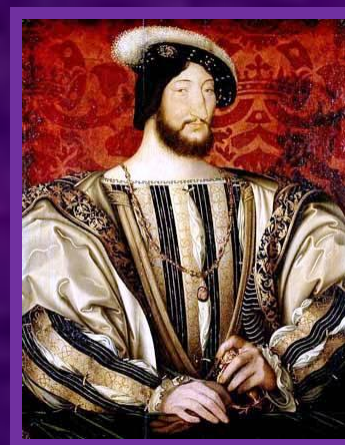
Франциск I Валуа. Король Франции