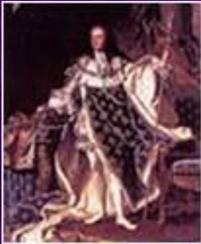
Французский король Людовик XV

Абсолютизм – форма правления, при которой власть принадлежит одному лицу – монарху.