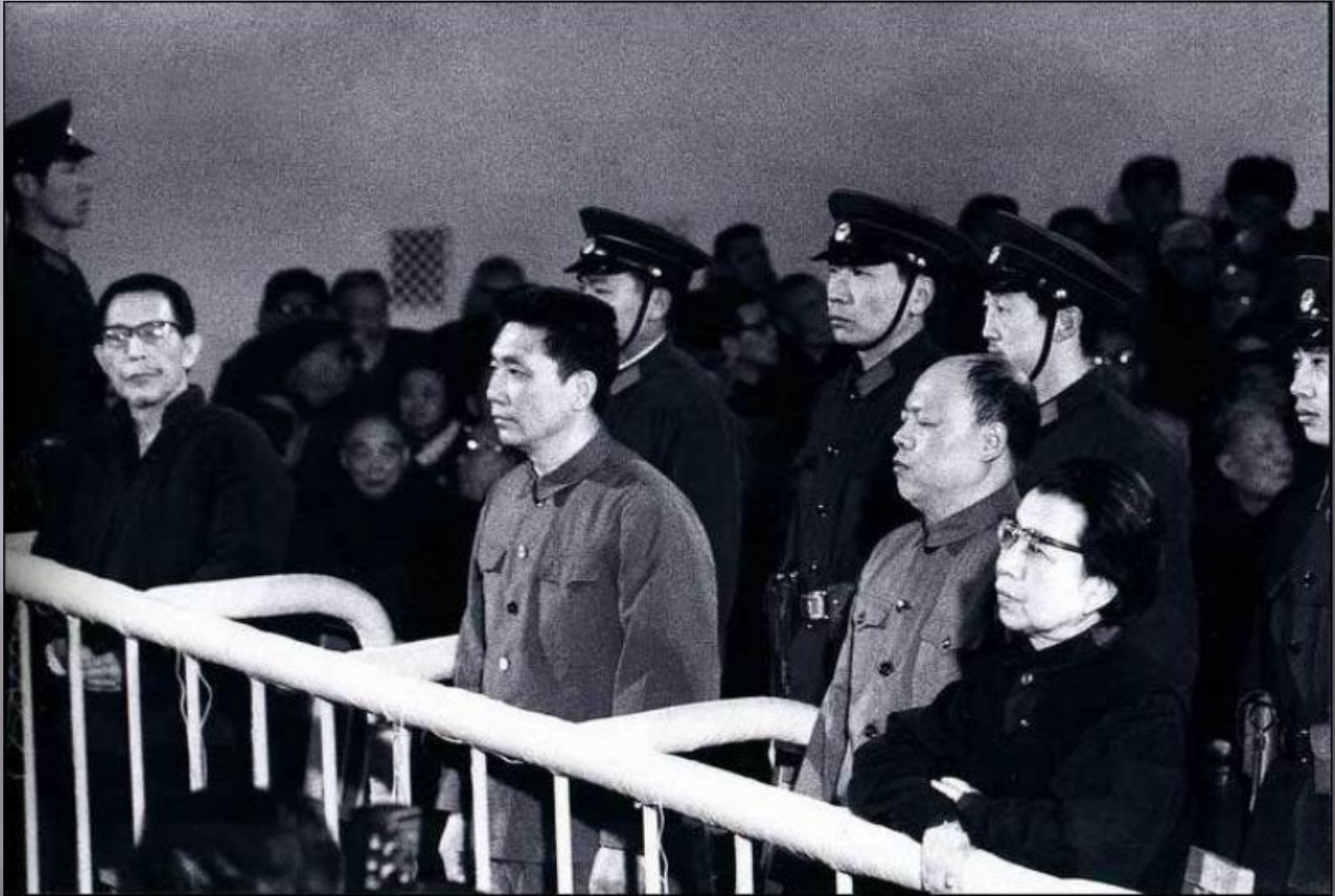
Суд над «бандой четырех»