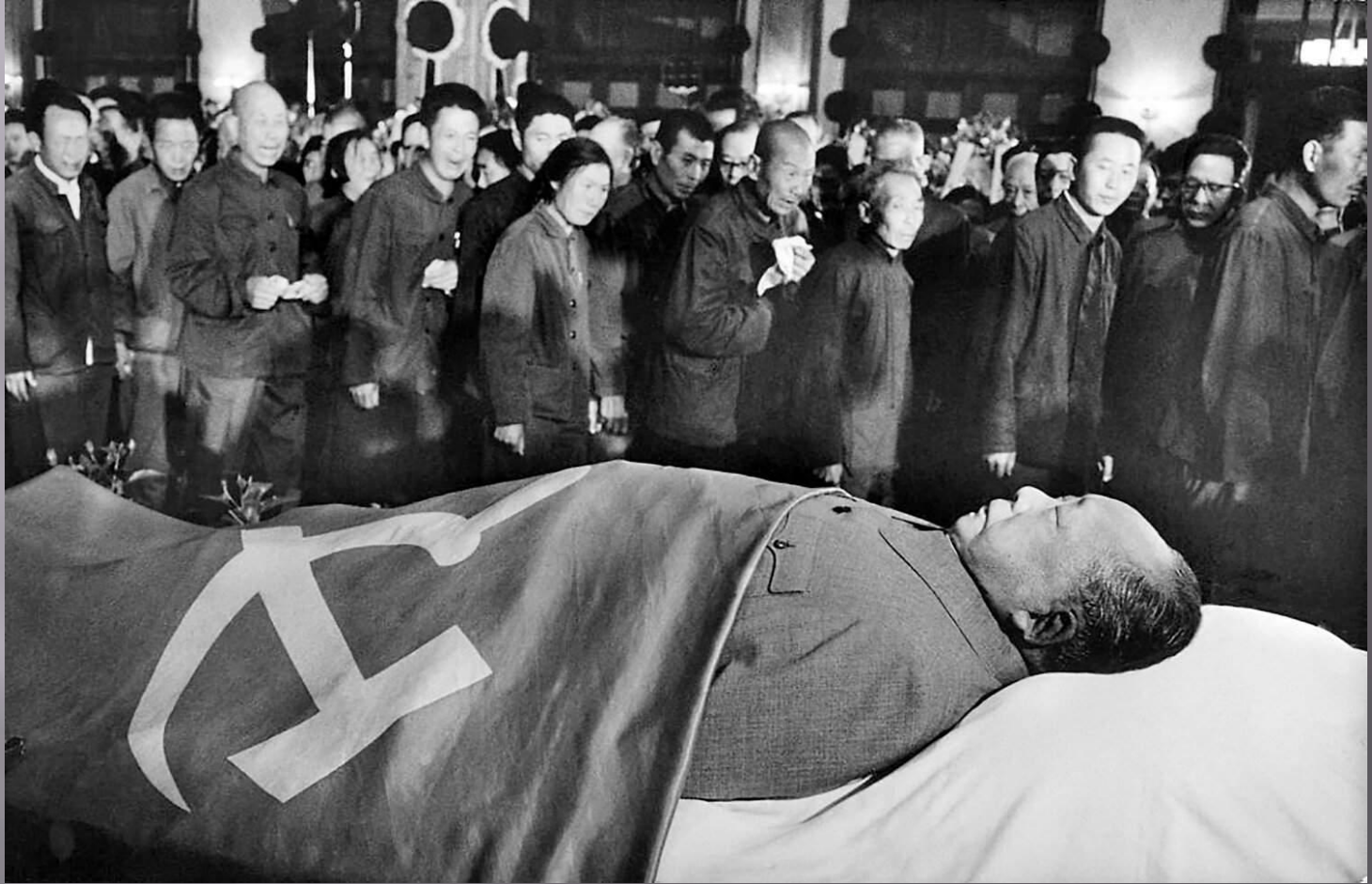
Похороны Мао Цзэдуна. 1976г.