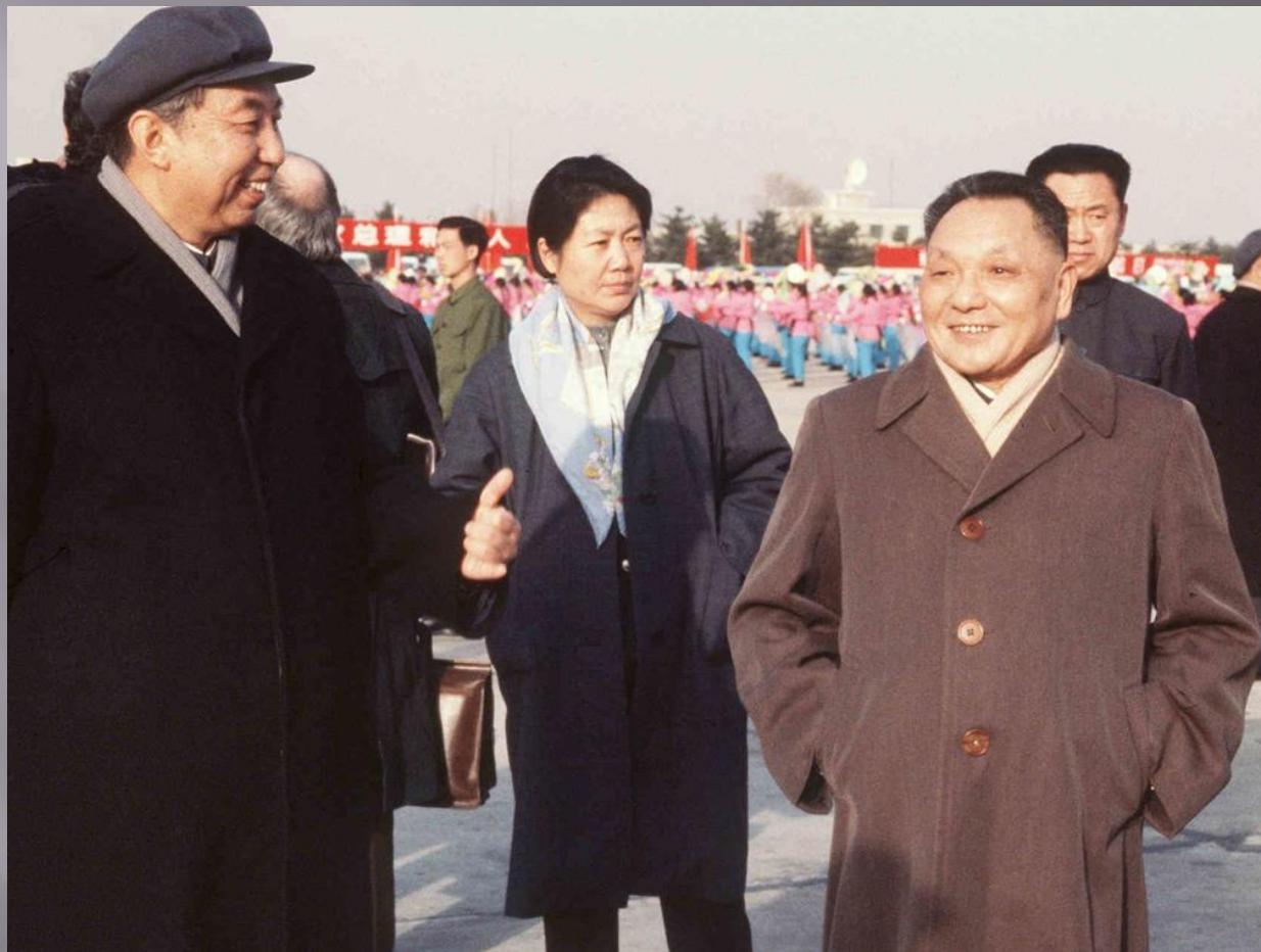
Хуа Гофэн (слева) и Дэн Сяопин (справа)