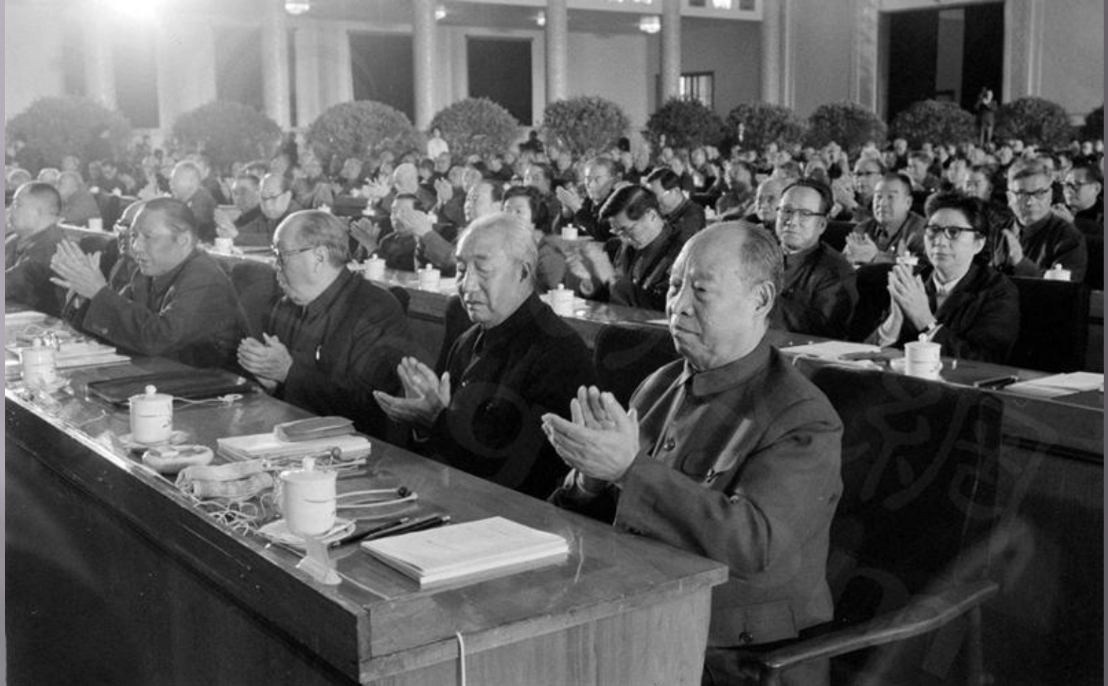
III пленум ЦК КПК XI созыва. 1978г.