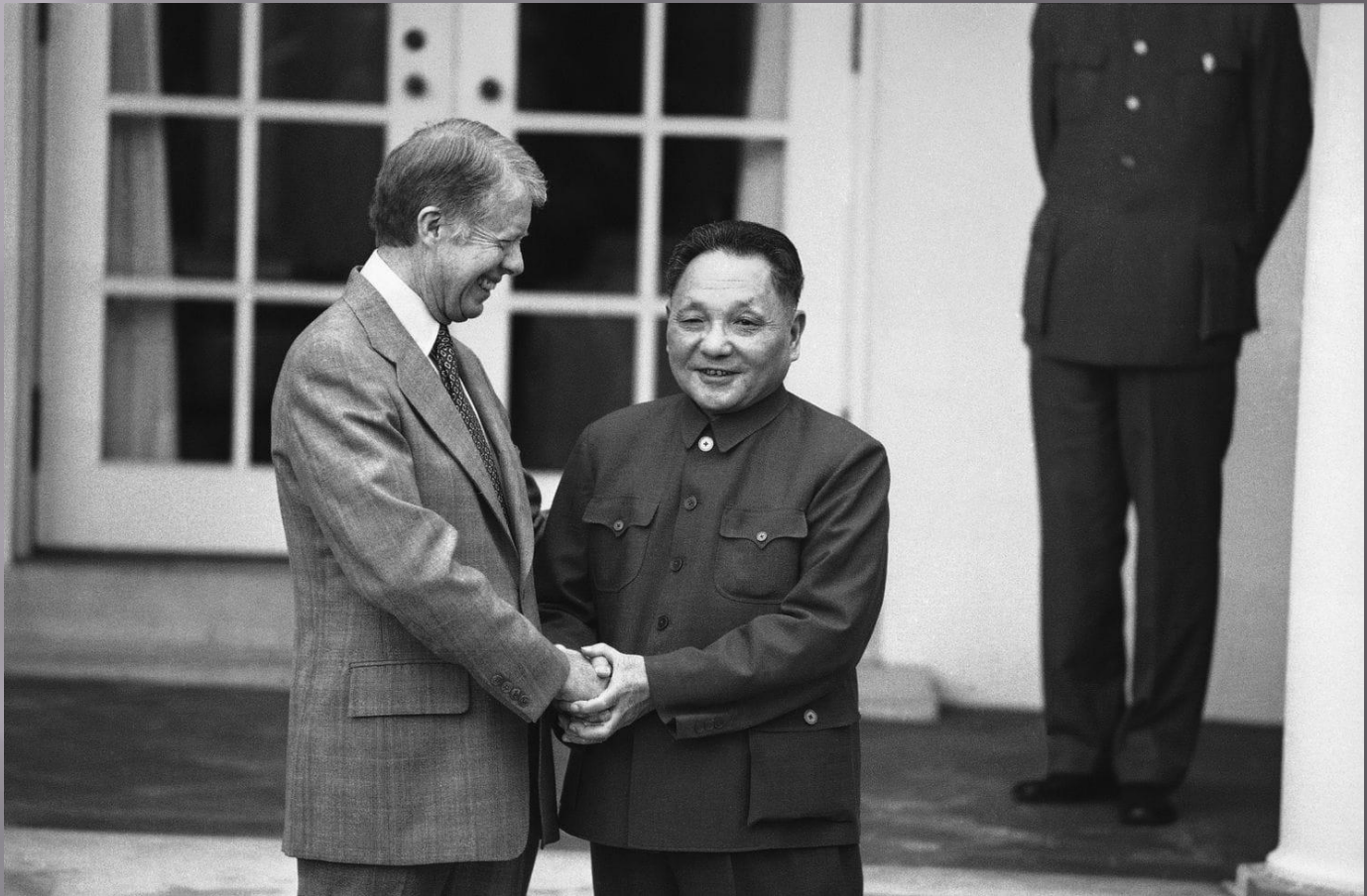
Визит Дэн Сяопина в США. 1979г.