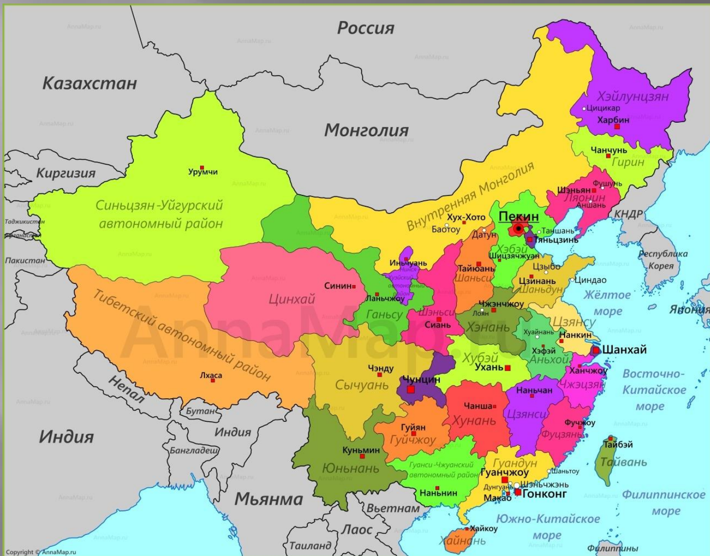
Административно-территориальное деление Китайской Народной Республики