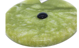
Плавно гаситель попадает на каплю клея

рез еличение ли мы падаем в лекулярн мир