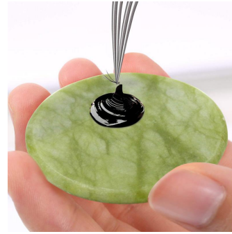
В клей макаю реснички