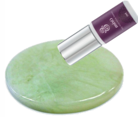
Плавно клей капает каплю клея