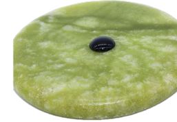
Капля клея остается Пары выходят из клея