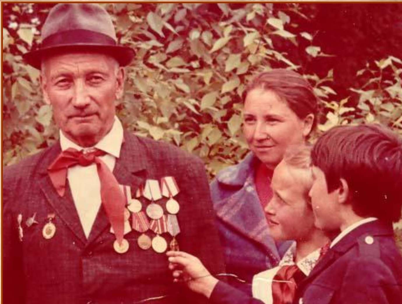
Прапрадедушка с пионерами и односельчанами дер. Арсланово, Буздякский район, Башкортостан. 1978год