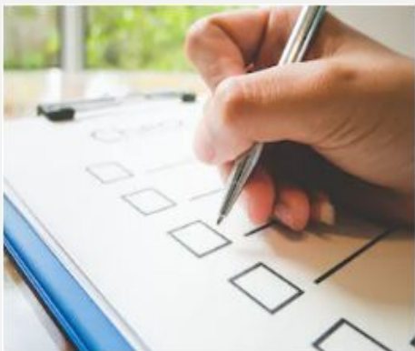
Бюджет с разделением расходов по спискам