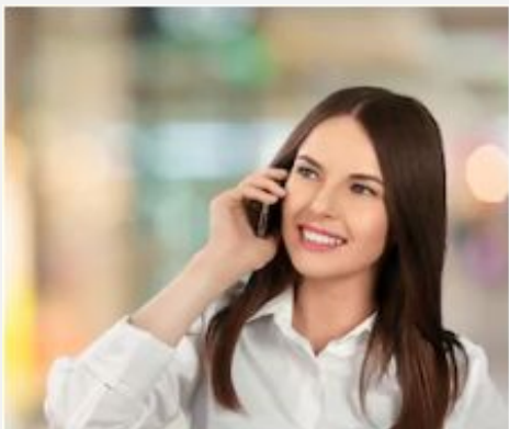
Бюджет по направлениям звонков и типам сервисов