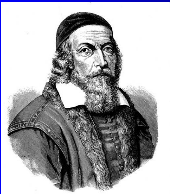
Ян Амос Коменский (1592-1670)