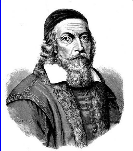
Ян Амос Коменский (1592-1670)