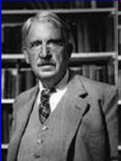
Джон Дьюи (1859 - 1952)