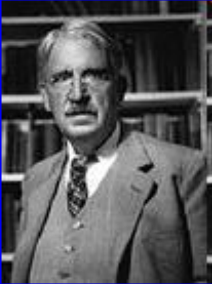
Джон Дьюи (1859 - 1952)