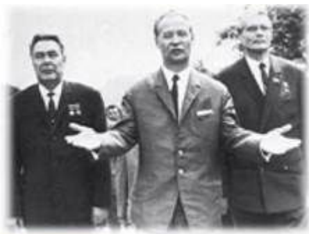
А.Дубчек (у центрі) з Л.Брежнєвим і М.Суловим.

Радикальні зміни в Чехословаччині викликали різку протидію з боку радянського керівництва, яке вважало їх “контрреволюцією” і закликала А. Дубчека зупинити процес реформ.