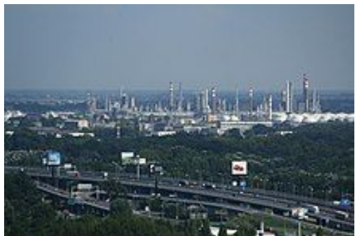
Братиславський нафтопереробний завод

Країна зробила значні кроки на шляху демократизації суспільного життя та формування соціально-орієнтованої ринкової економіки.