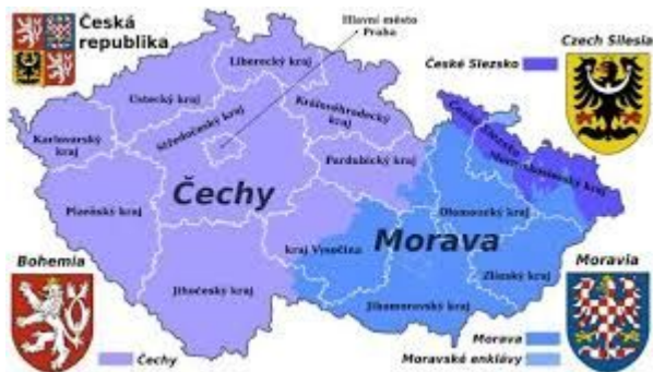
Мапа Чехії з історичними регіонами та сучасними адміністративними одиницями

Сучасне становище Чехії характеризується політичною стабільністю, розвинутою економікою, прагненням інтегруватися у світове співтовариство.