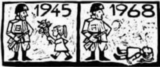
малюнок 1968 р.

Інтервенція військ Варшавського договору в Чехословаччину викликала хвилю протестів у всьому світі.