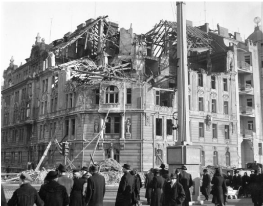
Наслідки війни. Прага. Травень 1945 р.