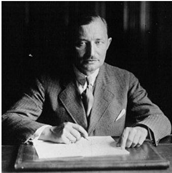
Зденек Фірлінгер, Голова Національного фронту, Голова уряду (1945 – 1946).

У ході боротьби проти нацизму у країні сформувався патріотичний Національний фронт, який об'єднував представників різних політичних партій.