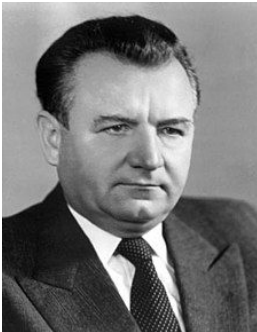
Клемент Готвальд, Голова уряду (1946 – 1948)