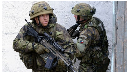
Чеські військові у складі сил НАТО на навчаннях