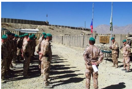
Чеський миротворчий контингент в Афганістані. 2019 р.