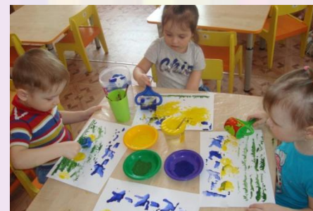
Рисование используя ролики-штампы