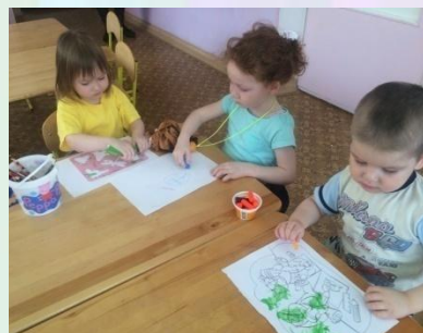
Рисование используя трафареты