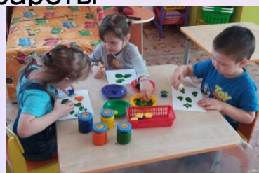
Рисование используя штампы