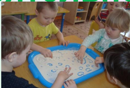
Рисование на манке