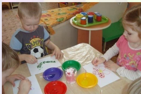
Рисование ватными палочками