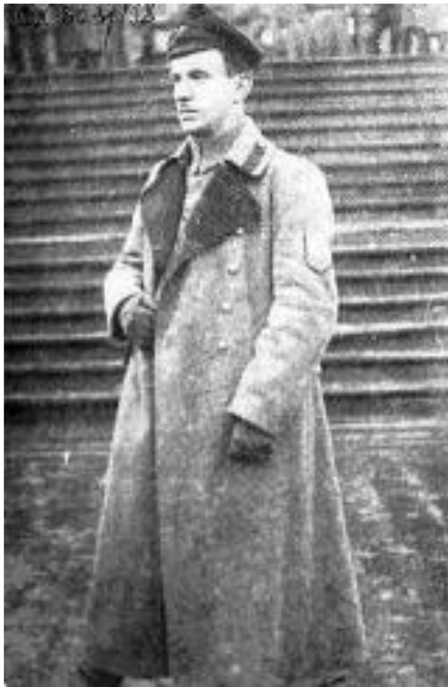
Р.Гайда- командующий чехословацким

В Самвре Комуч создал свои вооруженные отряды и захватил Казань. В ответ Советское правительство создало Восточный фронт. Вскоре туда прибыл Л.Троцкий. 2 сентября ВЦИК объявил страну единым военным лагерем и вскоре началось контрнаступление. Поволжье было освобождено. В ответ эсеры пригласили на должность военного министра А.Колчака. Но его окружение произвело переворот Колчак стал «Верховным правителем»