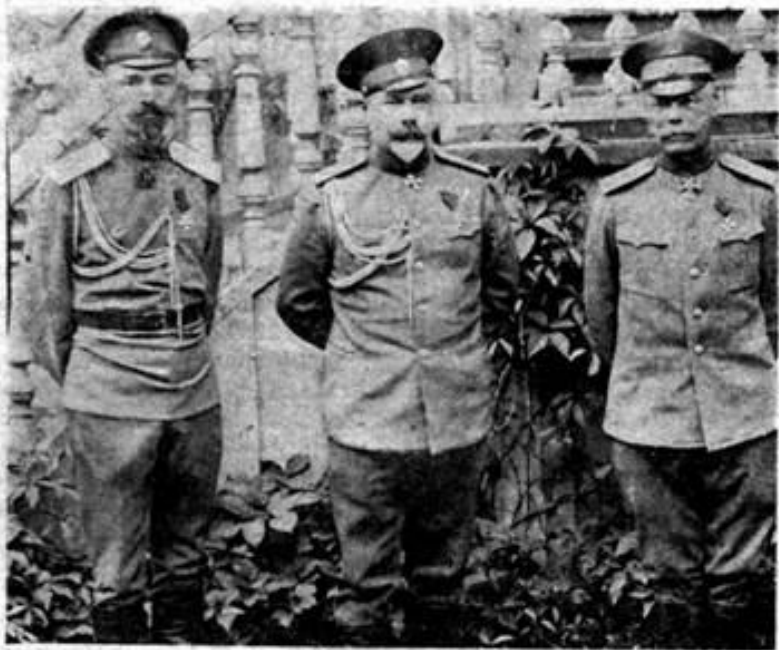
Вожди добровольческой армии: слева — ген. С. Л. Марков, в центре — ген. А. И. Деникин, справа — ген. М. В. Алексеев.