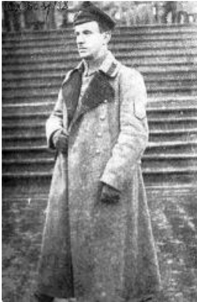
Р.Гайда- командующий чехословацким

В Самвре Комуч создал свои вооруженные отряды и захватил Казань. В ответ Советское правительство создало Восточный фронт. Вскоре туда прибыл Л.Троцкий. 2 сентября ВЦИК объявил страну единым военным лагерем и вскоре началось контрнаступление. Поволжье было освобождено. В ответ эсеры пригласили на должность военного министра А.Колчака. Но его окружение произвело переворот Колчак стал «Верховным правителем»