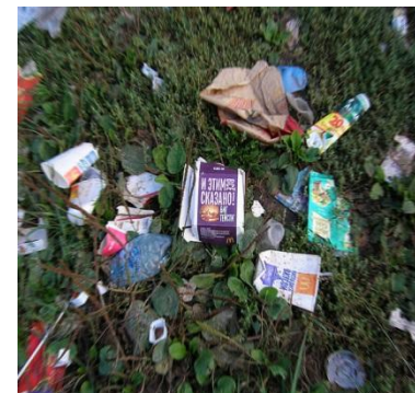
Защита окружающей среды