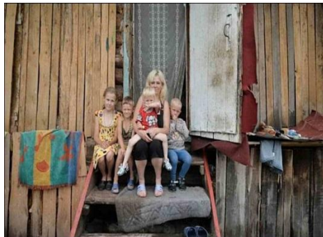
Поддержка семьи и малообеспеченных