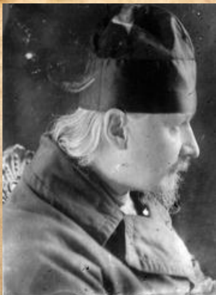
схнархим. Игнатий (Лебедев)