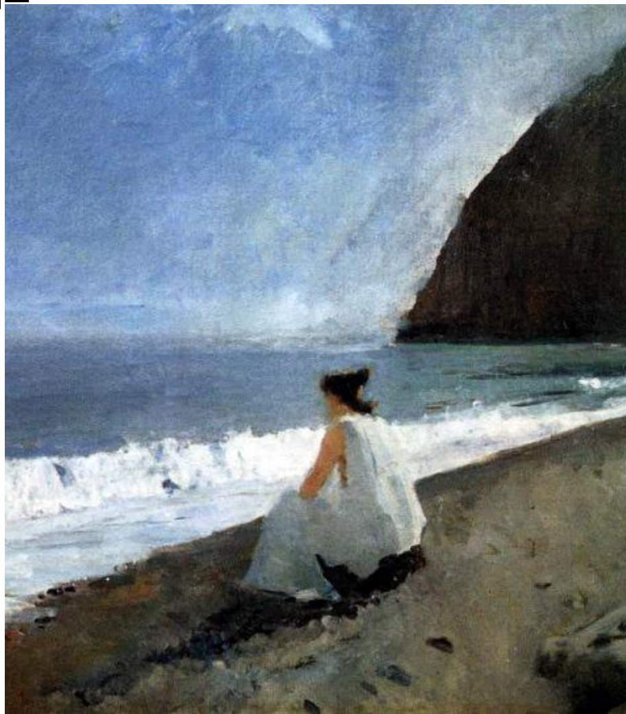
В. Серов «Ифигения в Тавриде»

Повинуясь велению Дельфийского оракула, сын Агамемнона Орест вместе со своим другом Пиладом отправились в Тавриду (современный Крым) за статуей Артемиды. Статуя находилась в знаменитом храме. Но местные жители поймали Ореста и Пилада, и решили принести их в жертву Артемиде. По счастливой случайности жрицей в этом храме была сестра Ореста Ифигения. Она помогла Оресту и его другу спастись и получить статую. Они вместе вернулись в Грецию.