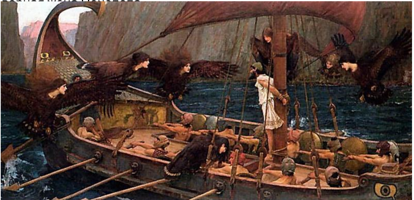
Дж. У. Уотерхаус «Одиссей и сирены»

Долгих десять лет возвращался домой Одиссей, где ждала его