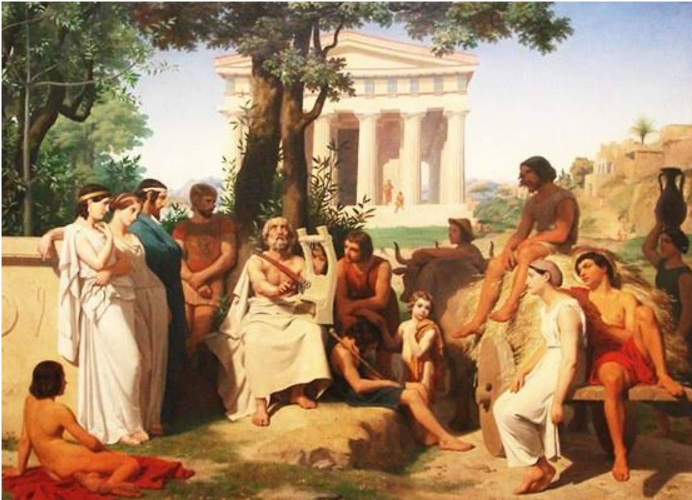
Джулио Романо «Аполлон и музы»

Но мифы рассказывали не только о богах. Любимым развлечением древних греков были театральные представления или рассказы поэтов-сказителей о подвигах великих героев-людей.