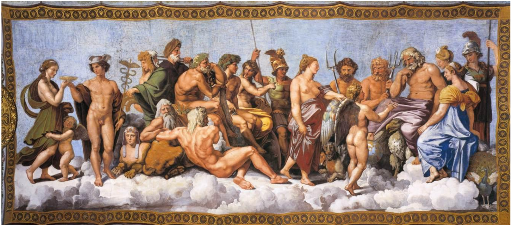
Рафаэль Санти «Совет богов»

Зевс вырос, освободил своих братьев и сестер и поднял восстание богов против титанов - титаномахию. В тяжелой битве, длившейся десять лет, Зевс сверг Кроноса. Так возникло новое поколение богов – их стали называть олимпийцами по горе Олимп, на которой они обитали.