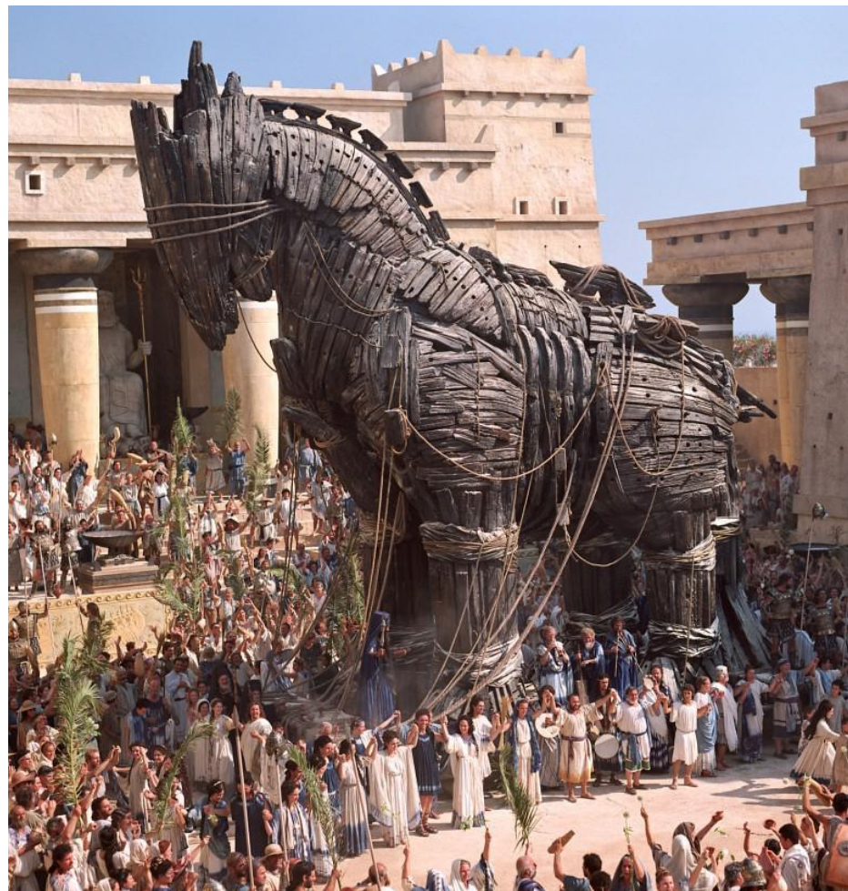
Кадр из фильма «Троя»

Парис, сын царя Трои Приама, похитил прекрасную Елену - жену царя Спарты Менелая. Разгневанный Менелай обратился к своему брату Агамемнону, чтобы тот собрал против Трои войско героев. Десять лет греки не могли победить троянцев, пока хитроумный Одиссей не придумал как одержать победу. Он построил огромного коня, якобы в дар троянцам, а внутри спрятал лучших воинов. Коня втащили в Трою, а ночью спрятавшиеся в коне воины открыли ворота и впустили войско Агамемнона. Так пала Троя.