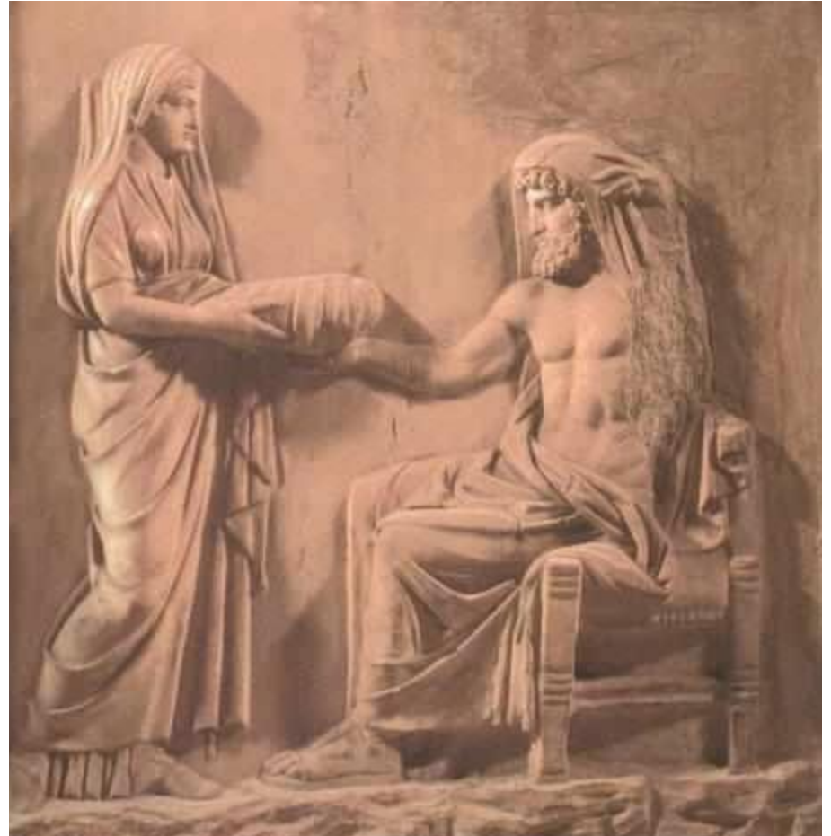
Рея обманывает Кроноса

У Кроноса и его жены Реи родились дети: Гестия – богиня домашнего очага, Деметра – богиня плодородия, Гера – богиня брака, Аид – бог подземного царства мертвых, Посейдон – бог моря и Зевс – бог неба, грозы и огня. Но Кронос проглатывал своих детей, так как Уран предсказал, что кто-то из них тоже его свергнет. Когда пришла очередь Зевса, то Рея обманом спасла своего сына, дав Кроносу вместо него завернутый в пеленки камень.