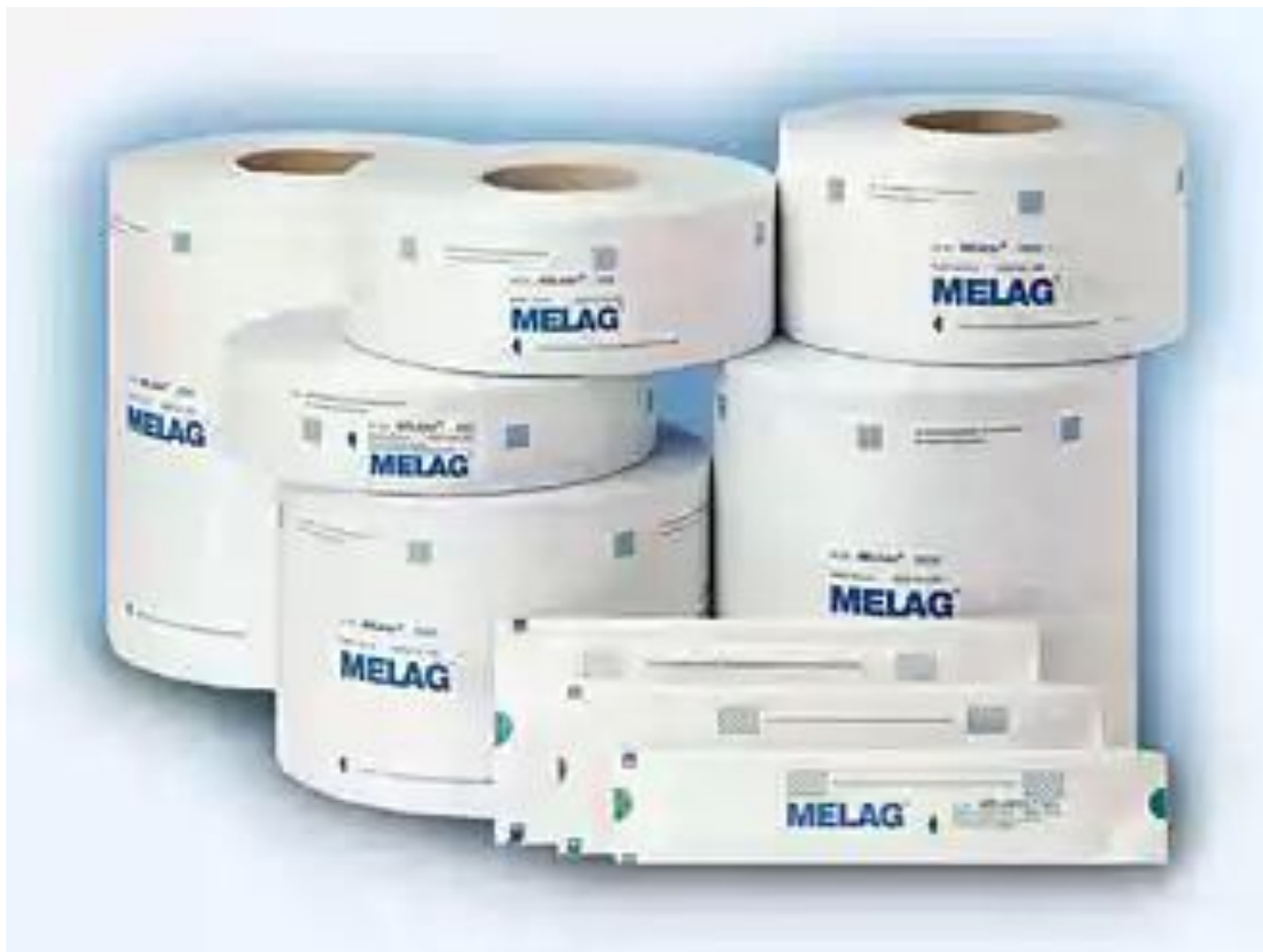
Прозрачная стерилизационная упаковка.