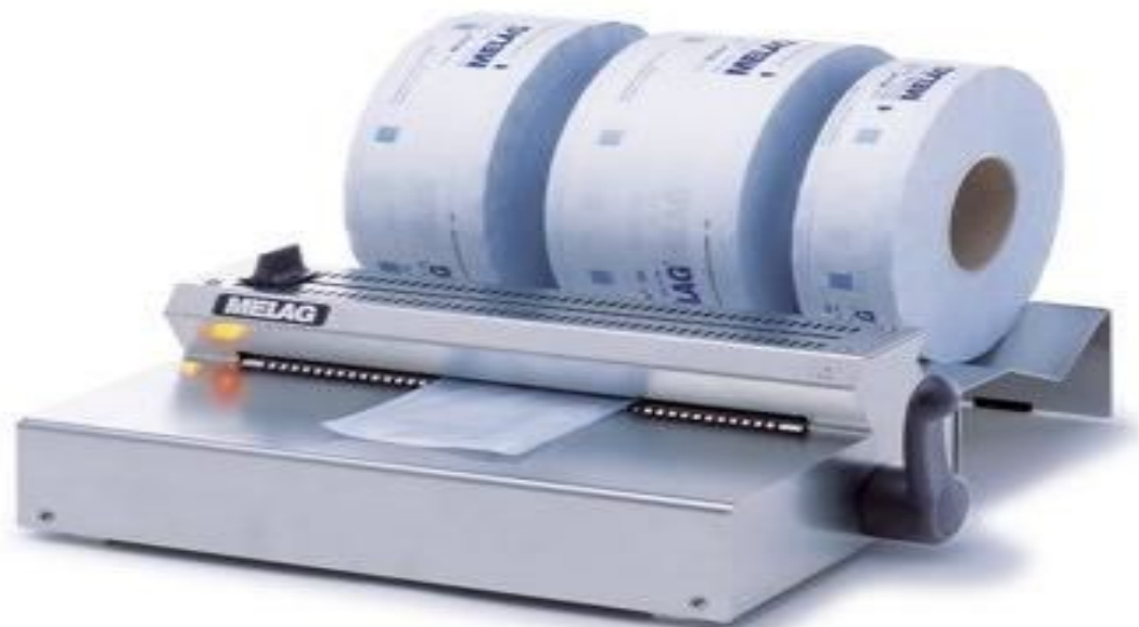
Упаковочные машинки MELAseal RH 100 Econom