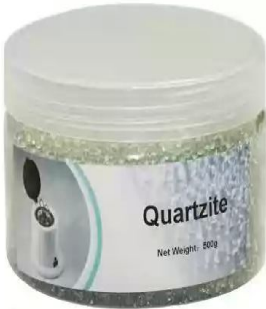
Гласперленовые шарики для стерилизатора Macrostop.