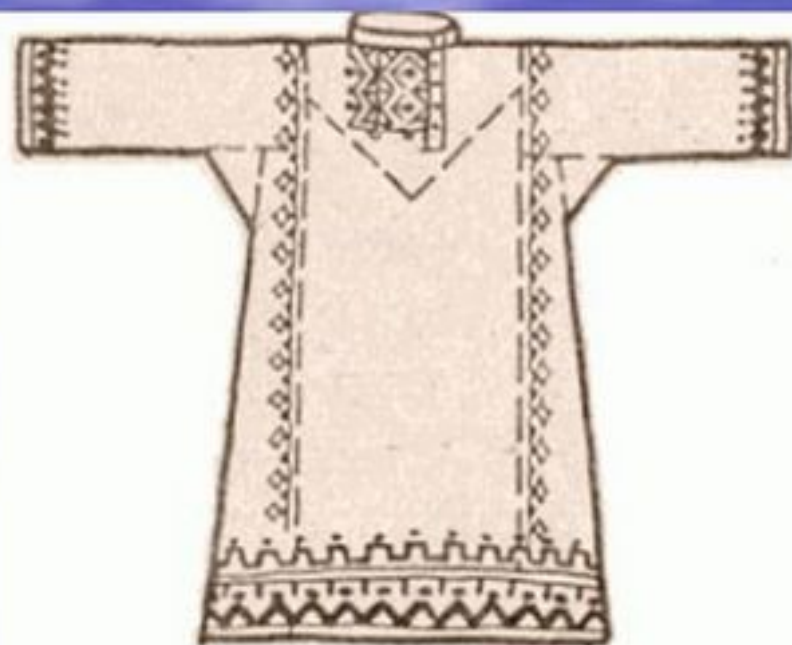
Рис. 3. Праздничная рубаха с косыми бочками и подплекой по косой. Перед.