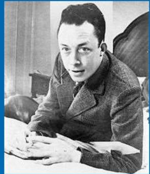
Французский мыслитель (1913-1960)

Те же, кто наполняют жизнь смыслом, рано или поздно понимают, что впереди (куда они изо всех сил идут) – смерть, Ничто. Смертны все – и наполняющие жизнь смыслом, и не наполняющие.