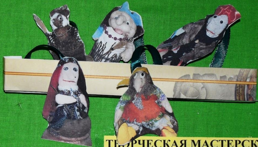
ТВОРЧЕСКАЯ МАСТЕРСКАЯ «Вот такая Я - Бабушка Яга!»