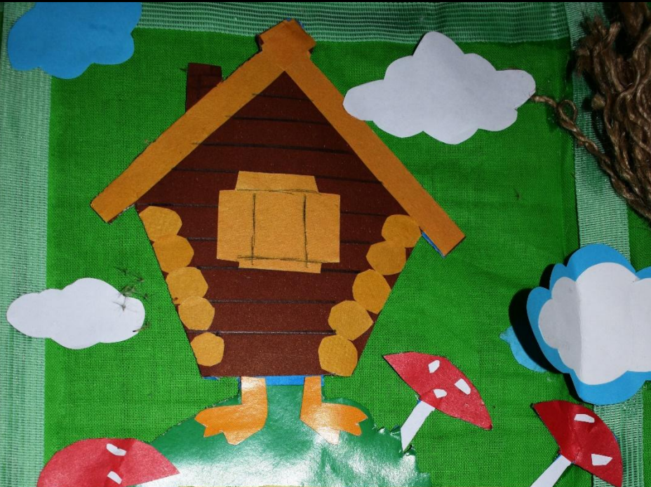
КОМПОЗИЦИЯ «Избушка на куриных ножках»