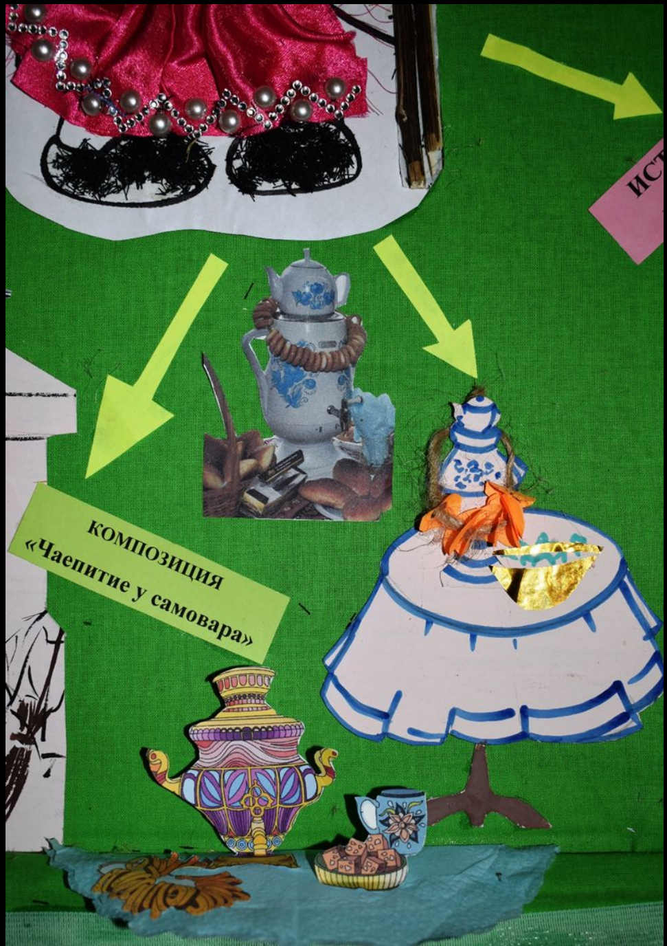
КОМПОЗИЦИЯ «Чаяпитие у самовара»