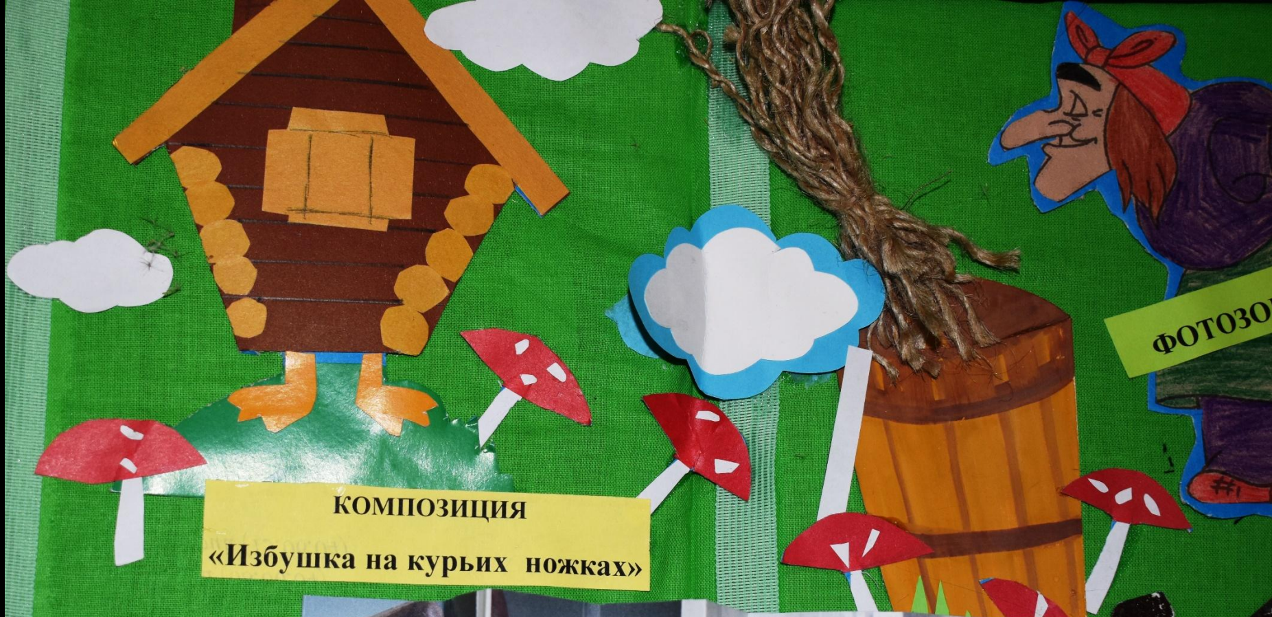
КОМПОЗИЦИЯ «Избушка на курьих ножках»