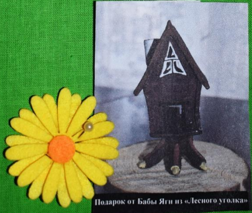
Поларок от Бабы Яги из «Лесного уголка»