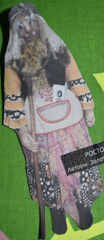
РОСТОВАЯ КУКЛА Авторы: Золоткова Е.Н., Кучина Н.В.