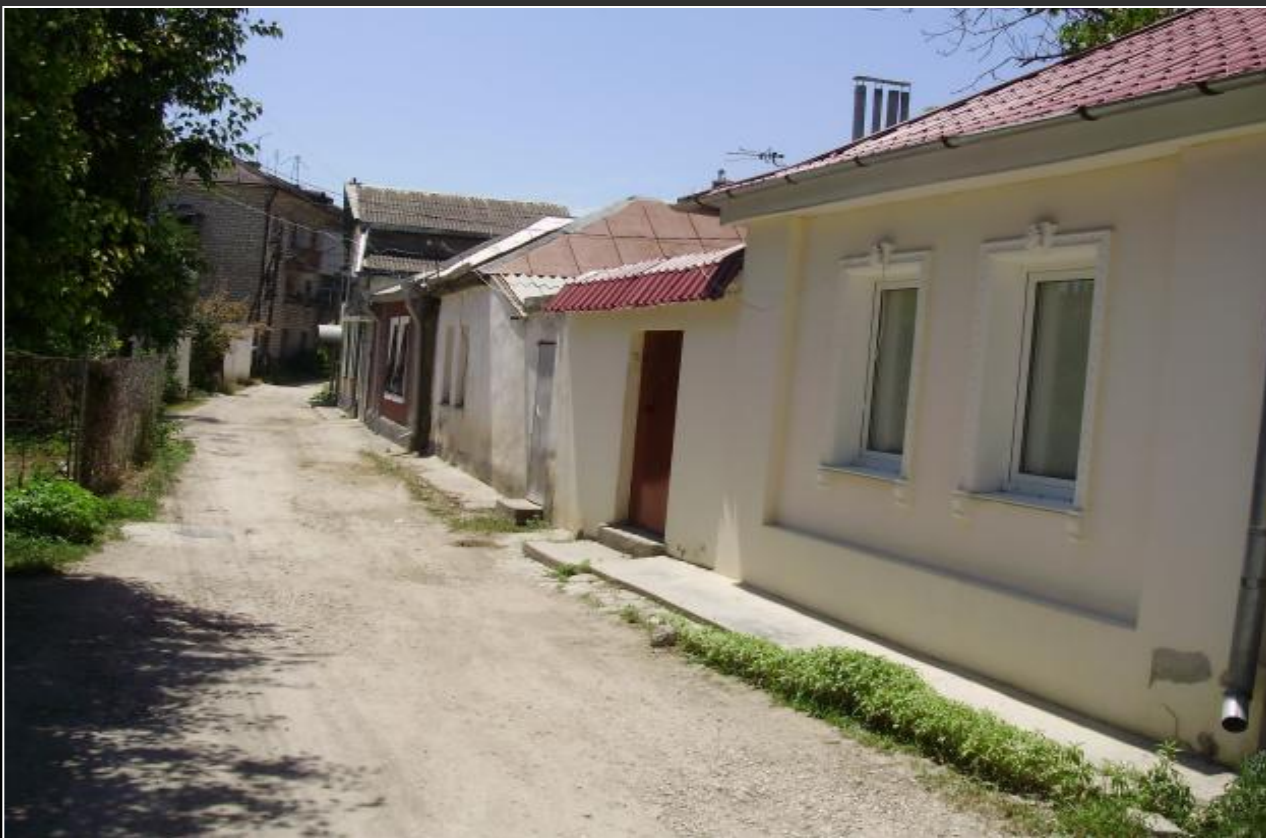
УЛИЦА Г.В. ПРОКОПЕНКО (с 1968 г.) – МЕЖДУ ул. Л.ТОЛСТОГО и ул. ГОГОЛЯ