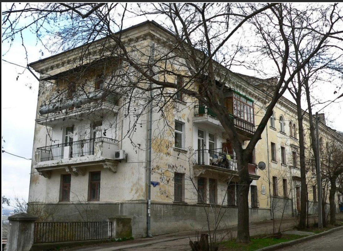
УЛИЦА Н.И. ТЕРЕЩЕНКО (до 1961 г. – ул. САДОВАЯ)