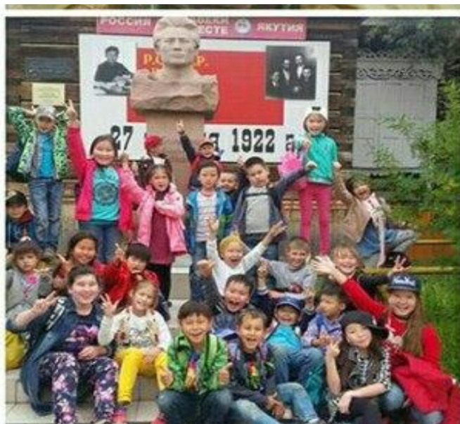
Музей М.К. Аммосова