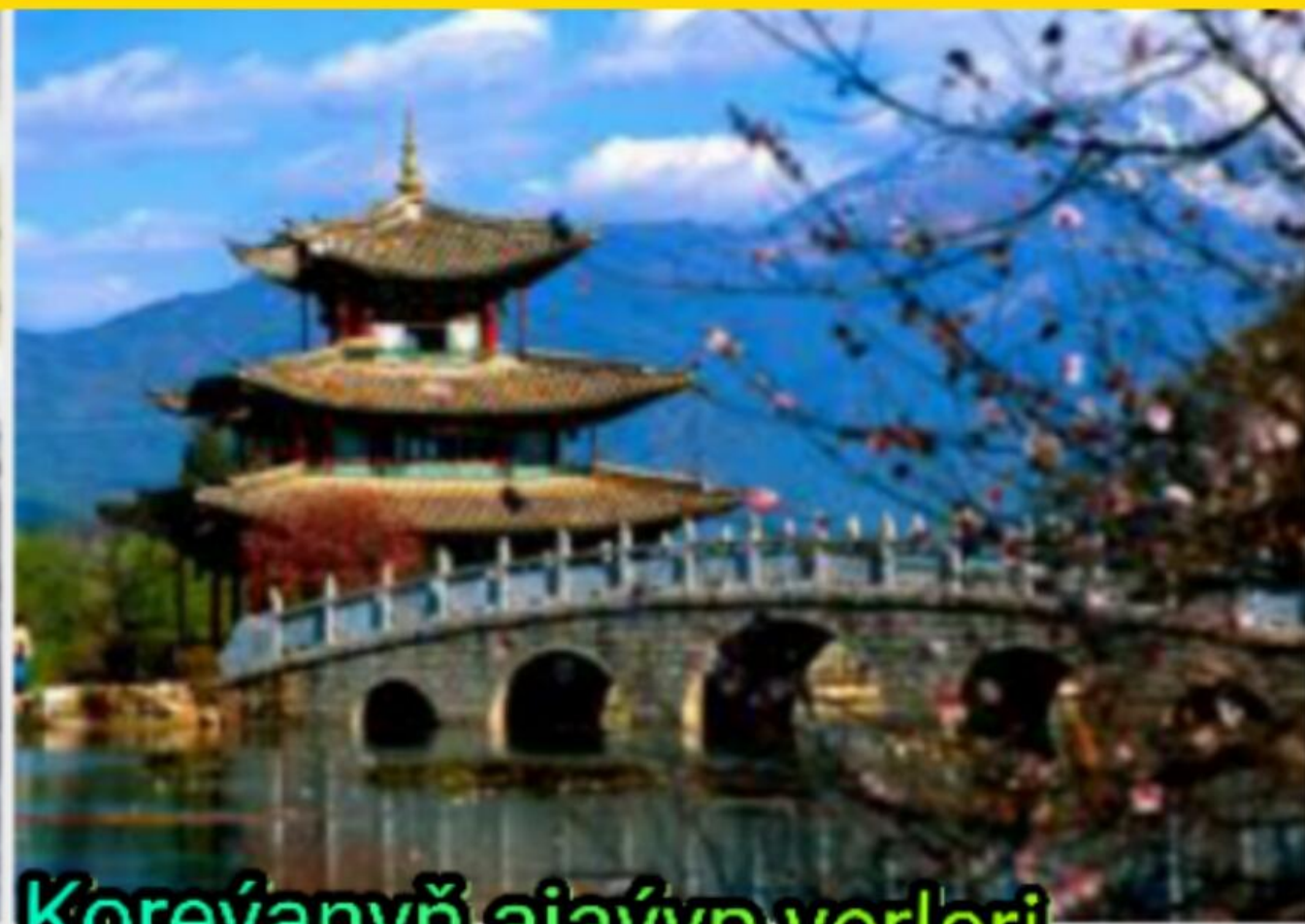
Koreýanyň ajaýyp yerleri