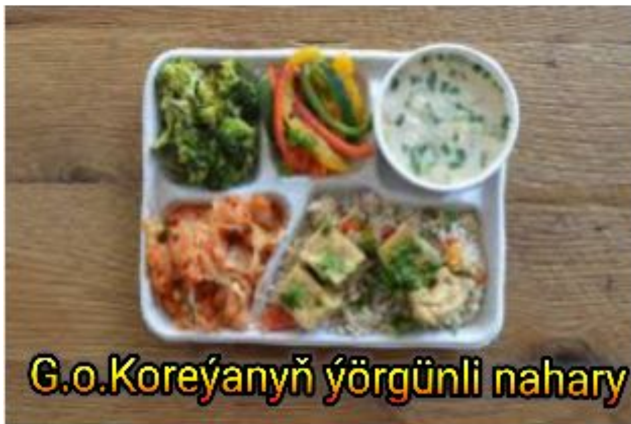
G.o.Koreýanyň ýörgünli nahary