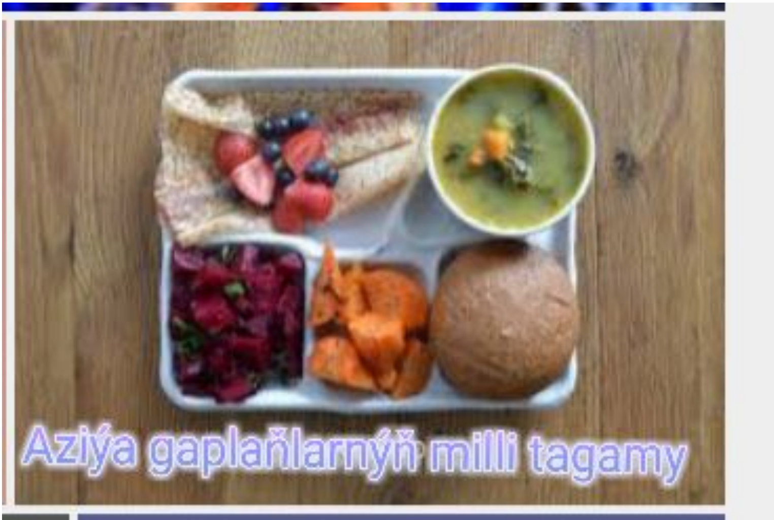
Aziya gaplaňlarnyň milli tagamy