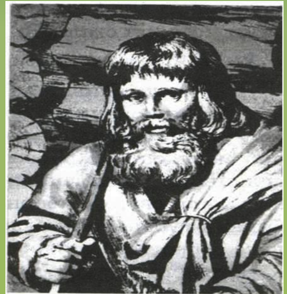
Крестьянин. Его внешний вид и труд не менялись на протяжении веков