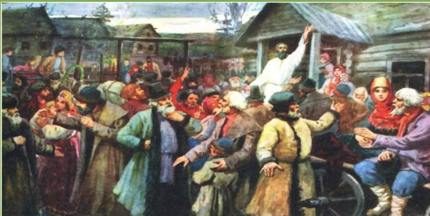
В Бездне. Художник В. Зайцев