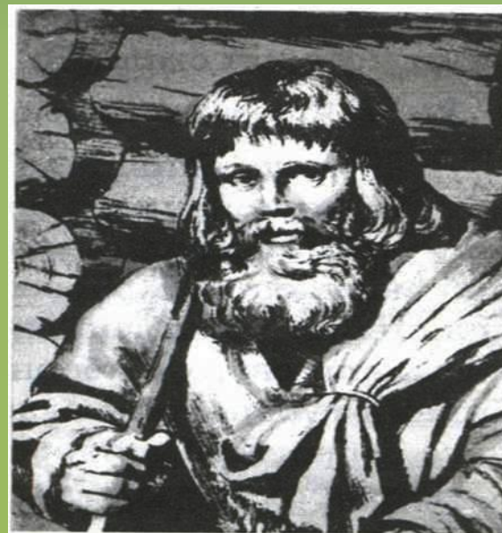
Крестьянин. Его внешний вид и труд не менялись на протяжении веков