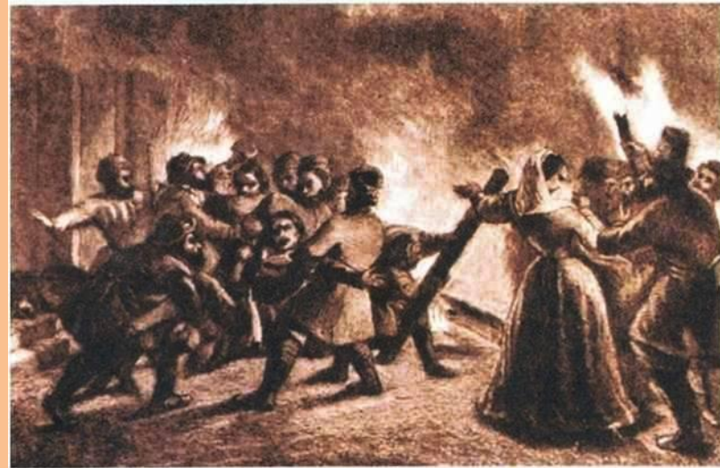
Поджог помещицкой усадьбы. Рисунок XIX в.