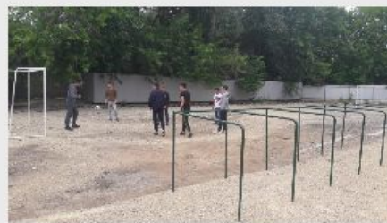
Открытый стадион широкого профиля по адресу: г. Казань, ул. Даурская, 32. Площадь 800 кв.м.