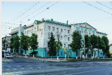
Корпус №1 по адресу: г. Казань, ул. Ершова, 58. Площадь 2800 кв.м.