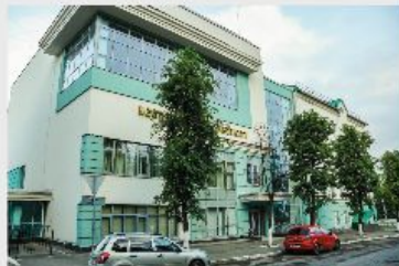
Корпус №2 по адресу: г. Казань, ул. Ершова, 58. Площадь 3000 кв.м.