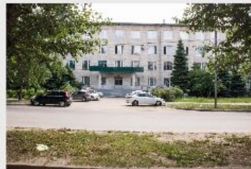
Корпус №3 по адресу: г. Казань, ул. Даурская, 32. Площадь 6100 кв.м.