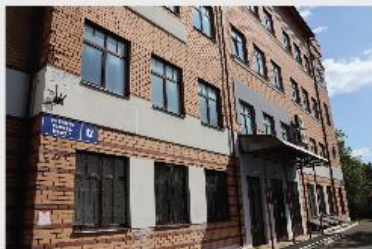
Корпус №4 по адресу: г. Казань, ул. Исаева, 12. Площадь 3100 кв.м.