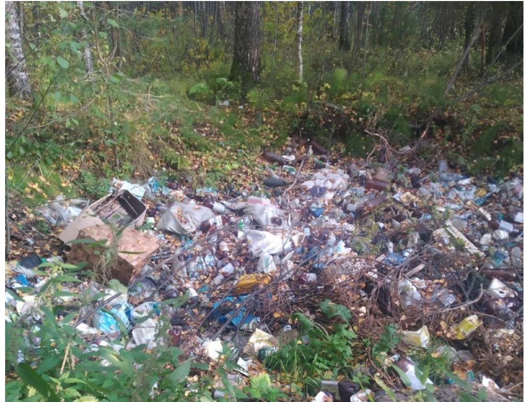
Свалка в лесу у с/п Светозарево

В результате происходит вымирание отдельных видов животных и растений.