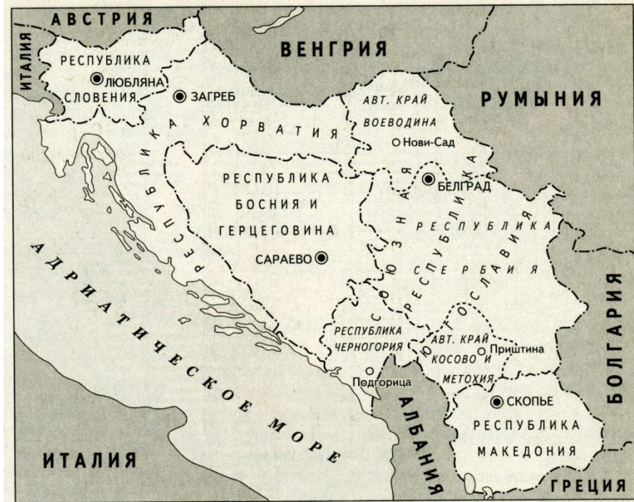
Рис. 10. Независимые государства, возникшие на месте бывшей СФРЮ