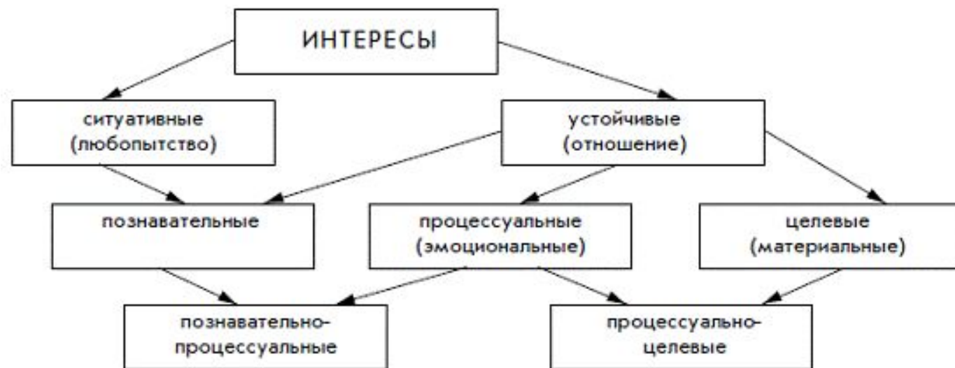
Рис. 8.1. Виды интересов