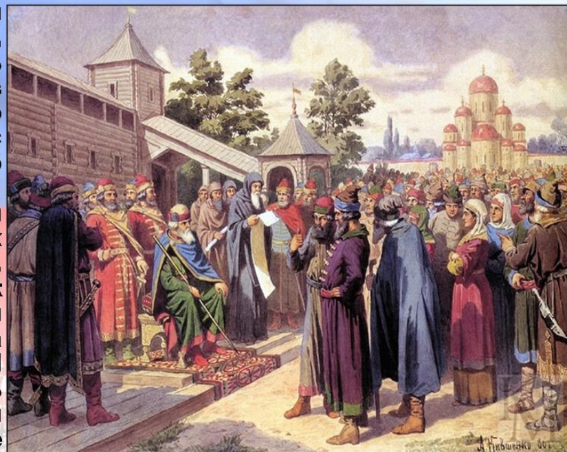
А. Кившенко. Чтение народу Русской Правды в присутствии великого князя Ярослава

Разговоры о конституции и конституционной монархии шли в период правления всех последующих императриц и императоров. Некоторые из них даже приближались к осуществлению этого замысла: проекты Сперанского при Александре I, и Лорис-Меликова при Александре II... А декабристы при Николае I так грезил конституцией, что даже пытались добиться её введения путём восстания. Так или иначе, к XX веку Россия подходит в статусе самодержавной монархии.