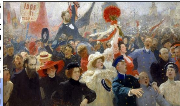
А.И. Репин. 17 Октября 1905

Последним этапом в развитии советской конституции стала смена «Сталинской» на «Брежневскую» Конституцию: всесоюзная от 1977 года, российская – от 1978. Следует отметить, что несмотря на фактический распад страны, советские законы продолжали действовать до декабря 1993 года, пока не была принята новая, действующая и по сей день Конституция Российской Федерации. Над её составлением трудились свыше тысячи авторов в течение более чем трёх лет.