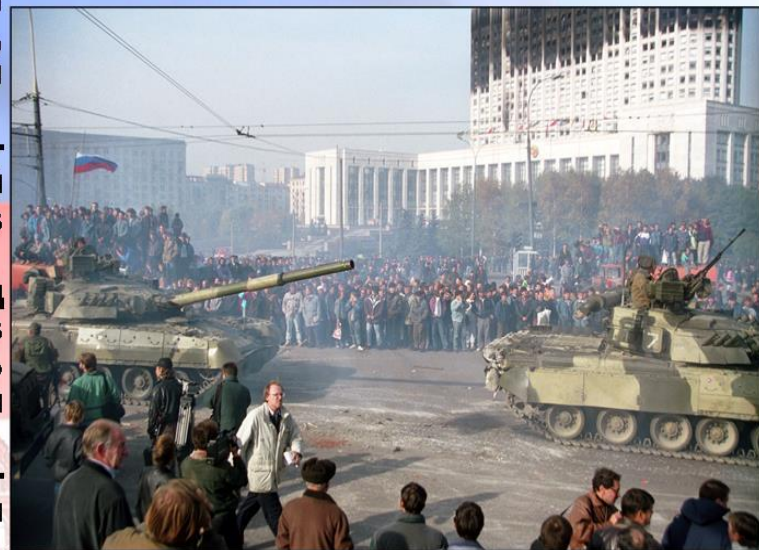
Милиция и баррикады в центре Москвы. 2 октября 1993 года

12 декабря 1993 года состоялся референдум - всенародное голосование по вопросу о принятии новой Конституции.