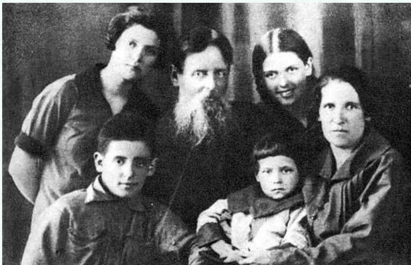
Семья Бажовых. Стоят Ольга, Павел Петрович, Елена. Сидят Алексей, Ариадна, Валентина Александровна. 1929 г.