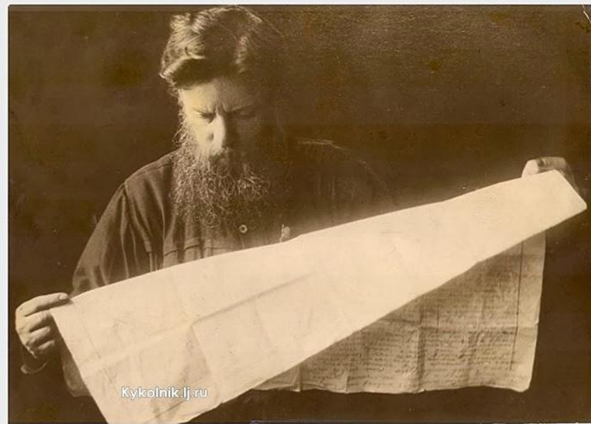
П.П.Бажов за чтением крестьянского письма

Работа с письмами читателей-крестьян окончательно определила увлечение Бажова фольклором. По его позднему признанию, многие из выражений, найденных им в письмах читателей «Крестьянской газеты», были использованы в его знаменитых уральских сказах.