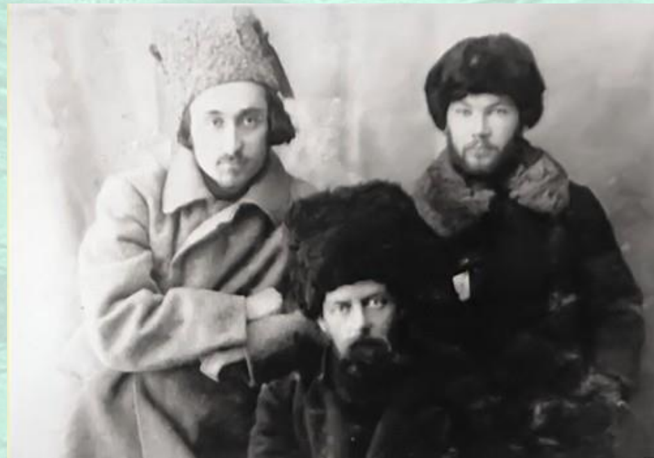
Бажов (в центре) среди бойцов отряда «Красные орлы». 1918 г.

После Февральской и Октябрьской революций Бажов ушел в работу общественных организаций. С начала открытых военных действий вступил добровольцем в Красную Армию и принимал участие в боевых операциях на Уральском фронте.