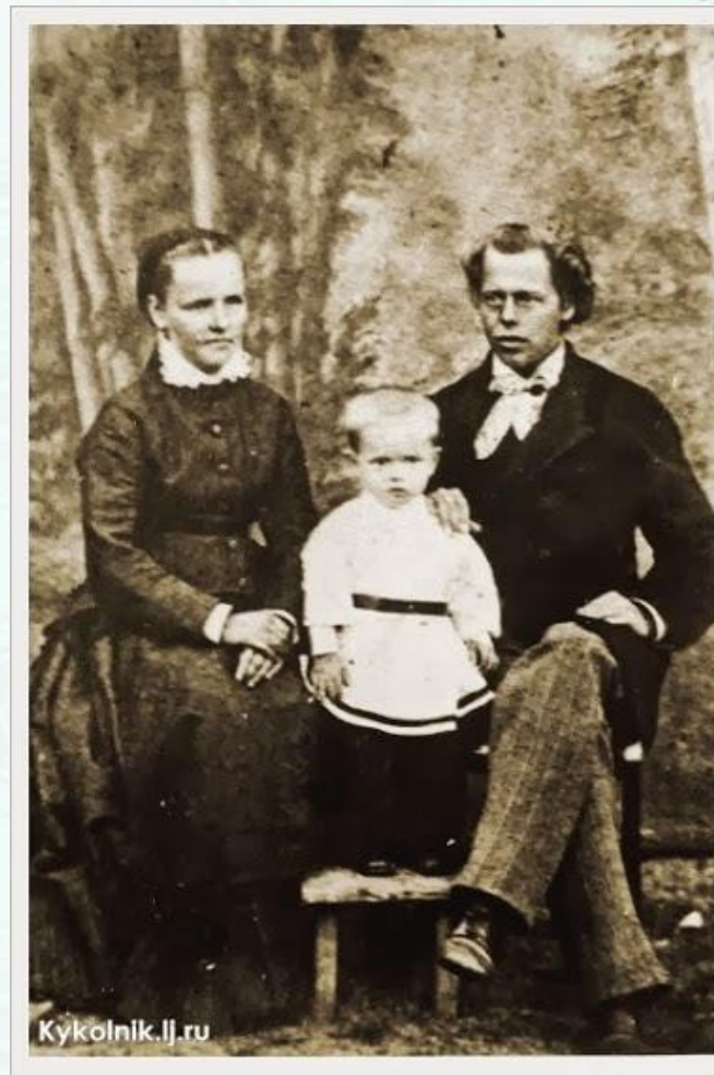
Павел Петрович с родителями Августой Стефановной и Петром Васильевичем Бажовыми

Его отец работал на металлургическом заводе. Был хорошим мастером, но с крепким характером. Мать будущего писателя была кружевницей, и это ремесло рукодельницы было большим подспорьем в семье.