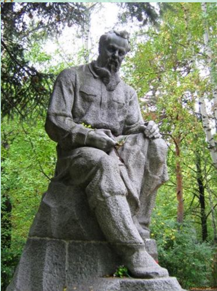
Памятник на могиле Павла Петровича Бажова в Екатеринбурге

Скончался Павел Петрович Бажов 3 декабря 1950 года в Москве, похоронен в Екатеринбурге.