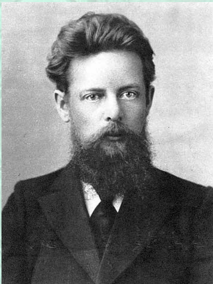
Фотография 1911 года

До 1917 работал учителем в Екатеринбурге и Камышлове. Каждый год во время летних каникул путешествовал по Уралу, собирал фольклор.