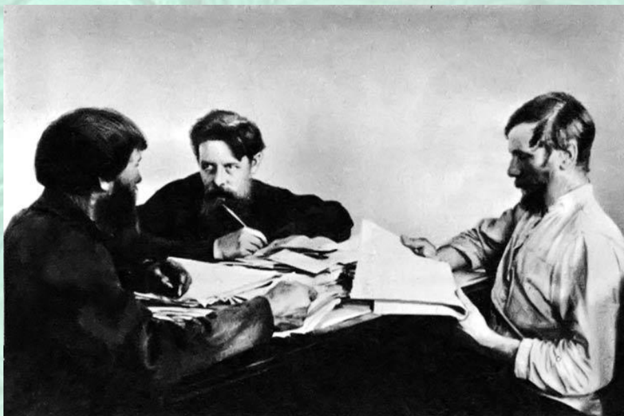
П.П.Бажов в редакции «Крестьянской газеты»

Работал журналистом в дивизионной газете «Окопная правда», в камышловской газете «Красный путь», а с 1923 – в свердловской «Крестьянской газете».