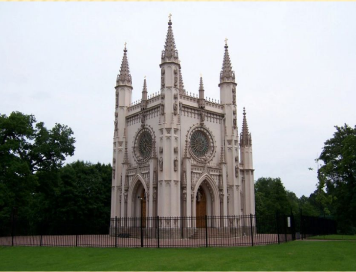
Капелла в Петергофе