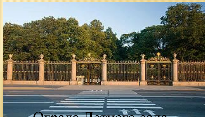
Ограда Летнего сада