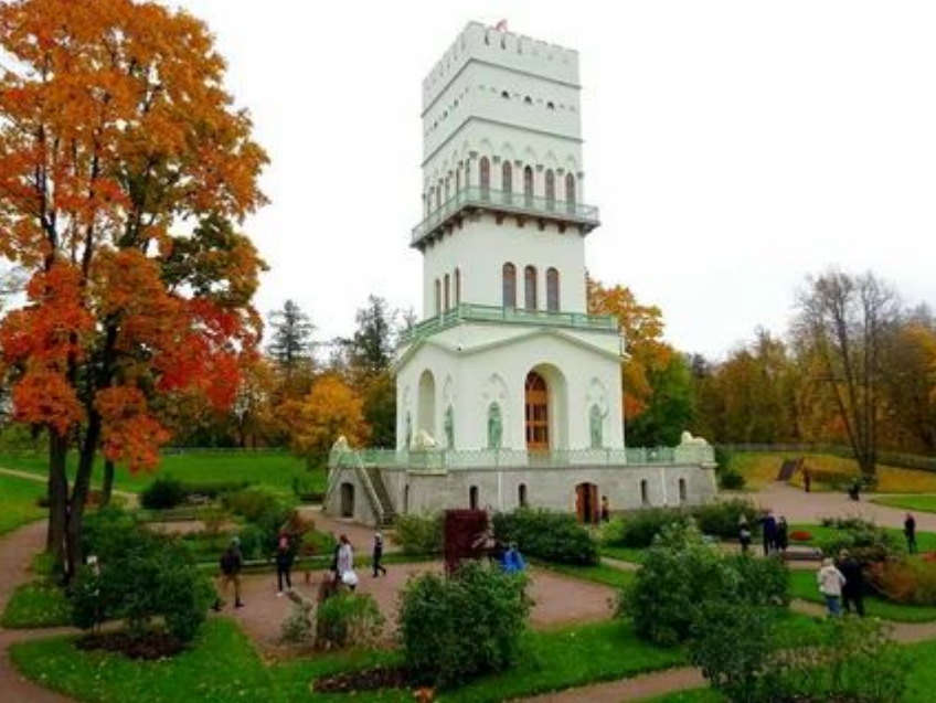
Белая башня в Царском селе