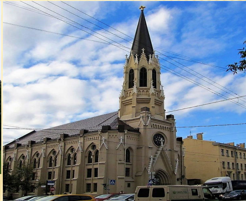
Лютеранская церковь на Василеостровской