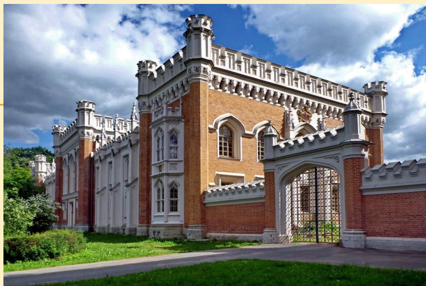
Дворцовые конюшни в Петергофе