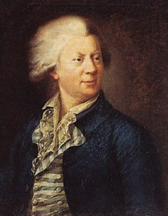
Юрий Матвеевич Фельтен