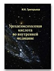
Урсодезоксихолевая кислота во внутренней медицине