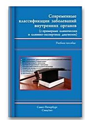
Современные классификации заболеваний внутренних органов