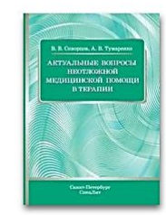
Актуальные вопросы неотложной медицинской помощи в терапии

- Вы имеете доступ к подписке института и к полному функционалу своего личного кабинета из дома или другого места.