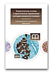
Теоретические основы и практическое применение методов иммуногистохимии