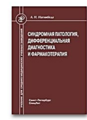
Синдромная патология, дифференциальная диагностика и фармакотерапия