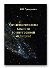
Урсодезоксихолевая кислота во внутренней медицине