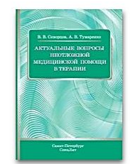
Актуальные вопросы неотложной медицинской помощи в терапии

- Теперь Вы прикреплены к институту и имеете доступ к подпискам института и к полному функционалу своего личного кабинета.