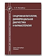
Синдромная патология, дифференциальная диагностика и фармакотерапия