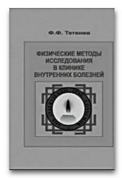
Физические методы исследования в клинике внутренних болезней