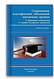
Современные классификации заболеваний внутренних органов