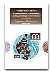
Теоретические основы и практическое применение методов иммуногистохимии