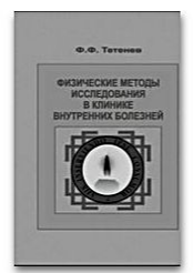
Физические методы исследования в клинике внутренних болезней