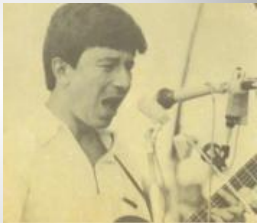
Первые участники Грушинского