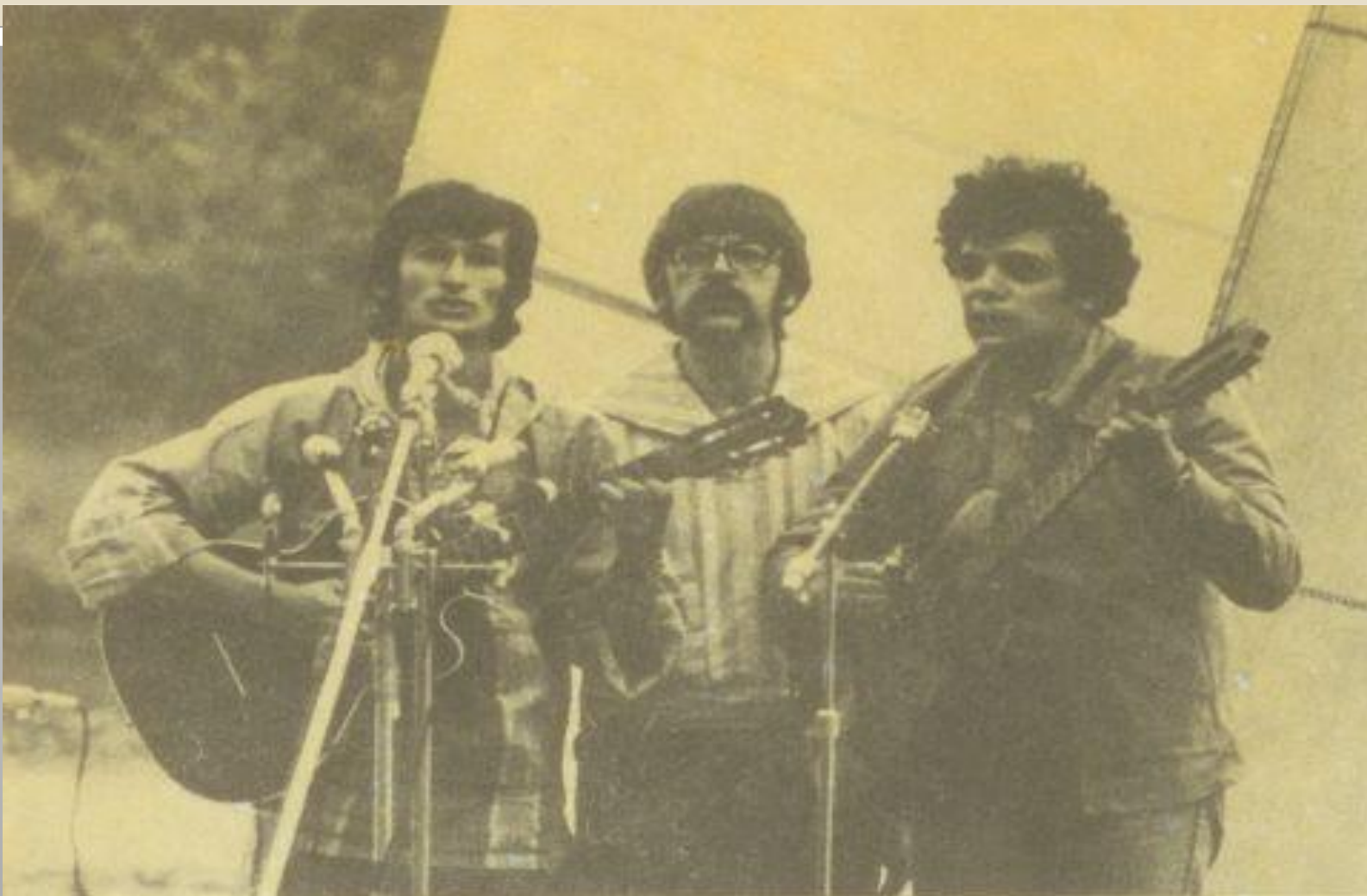
Трио «Веселые бобры»