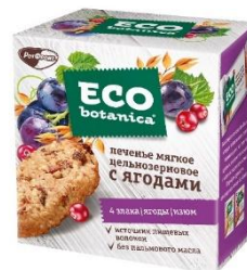
Печенье мягкое цельнозерновое с ягодами