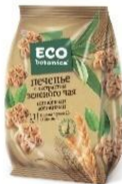
Печенье с экстрактом зеленого чая и пищевыми волокнами

Минимальные оффтейки и дистрибуция, почти не продается, 5%