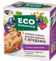
Печенье мягкое цельнозерновое с ягодами