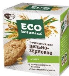
Печенье мягкое цельнозерновое