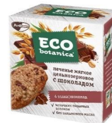
Печенье мягкое цельнозерновое с шоколадом