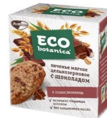
Печенье мягкое цельнозерновое с шоколадом