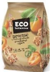
Печенье с бета-каротином и кусочками кураги